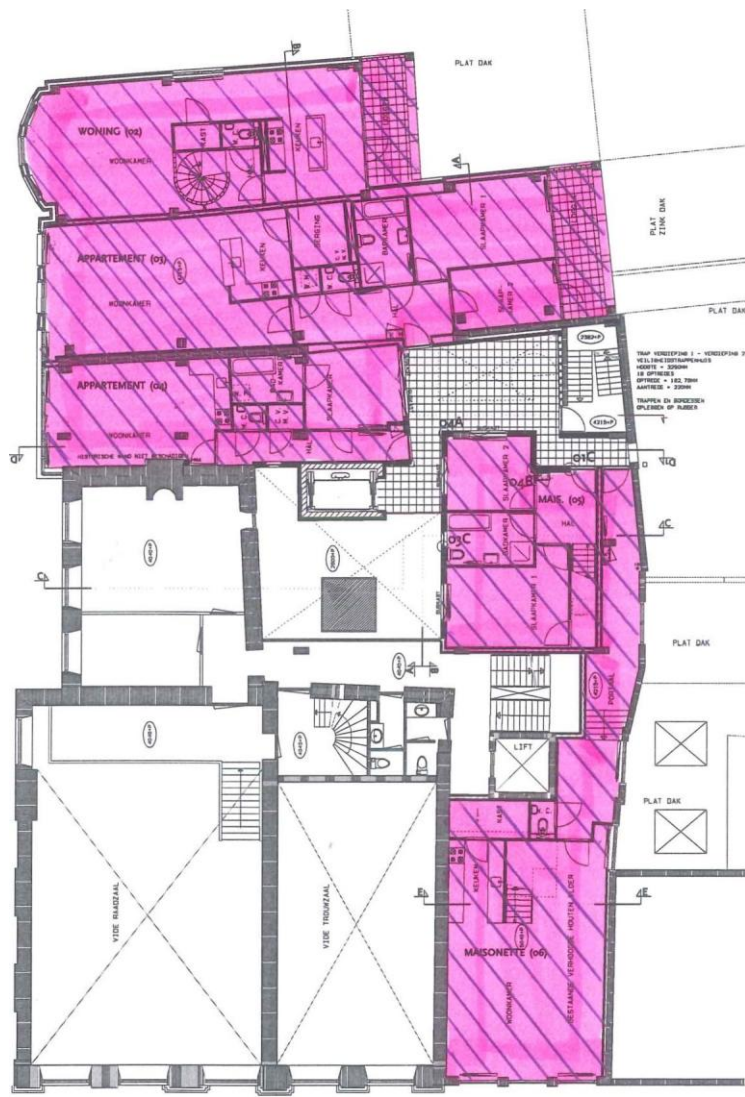
EERSTE VERDIEPING 4040+P / 5040+P