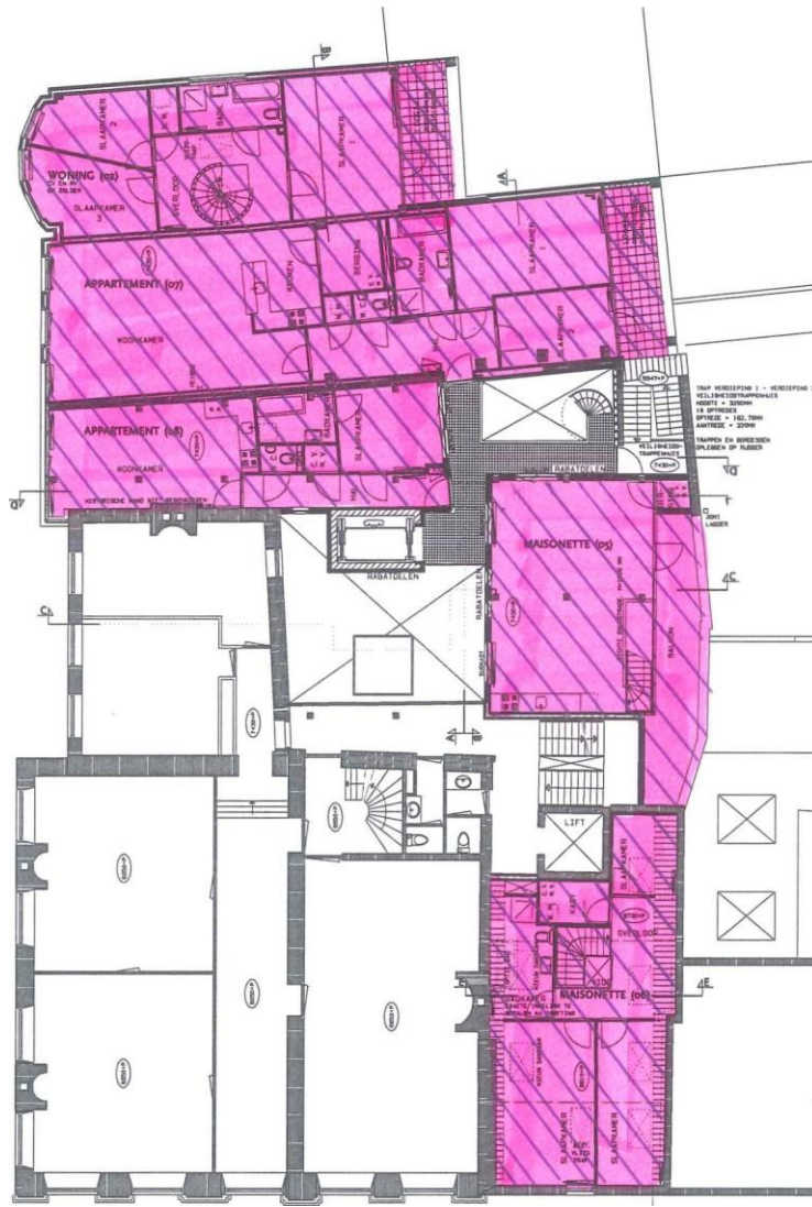
IWEEDE VERDIEPING 7430+P