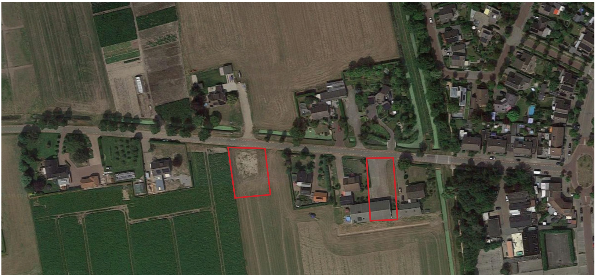
Luchtfoto met indicatie van de percelen aan de Spellewaardsestraat

Deze landschappelijke inpassing is opgesteld ten behoeve van de beoogde ontwikkeling voor de woningbouw aan de Spellewaardsestraat 45 en 53