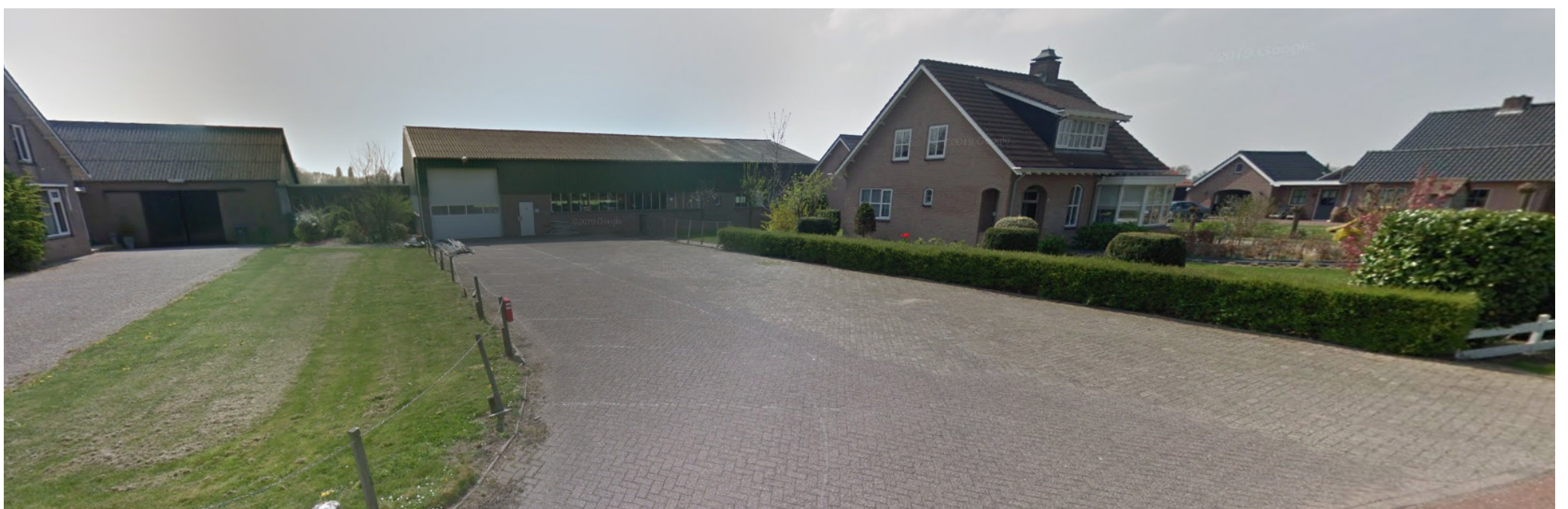
Streetview ter plaatse van Spellewaardsestraat 45