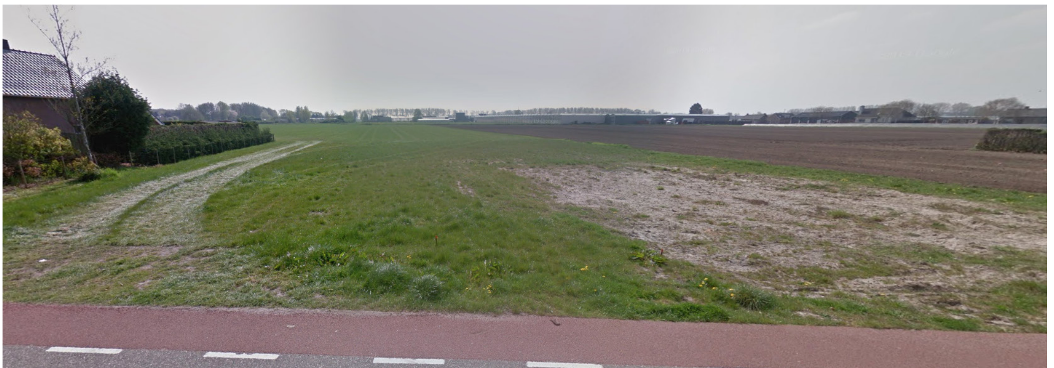
Streetview ter plaatse van Spellewaardsestraat 53