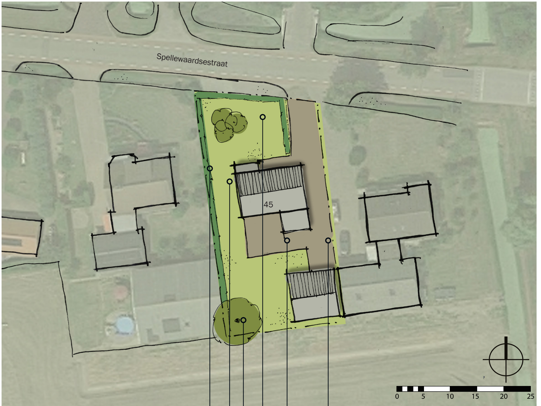
Inrichtingsschets nr. 45