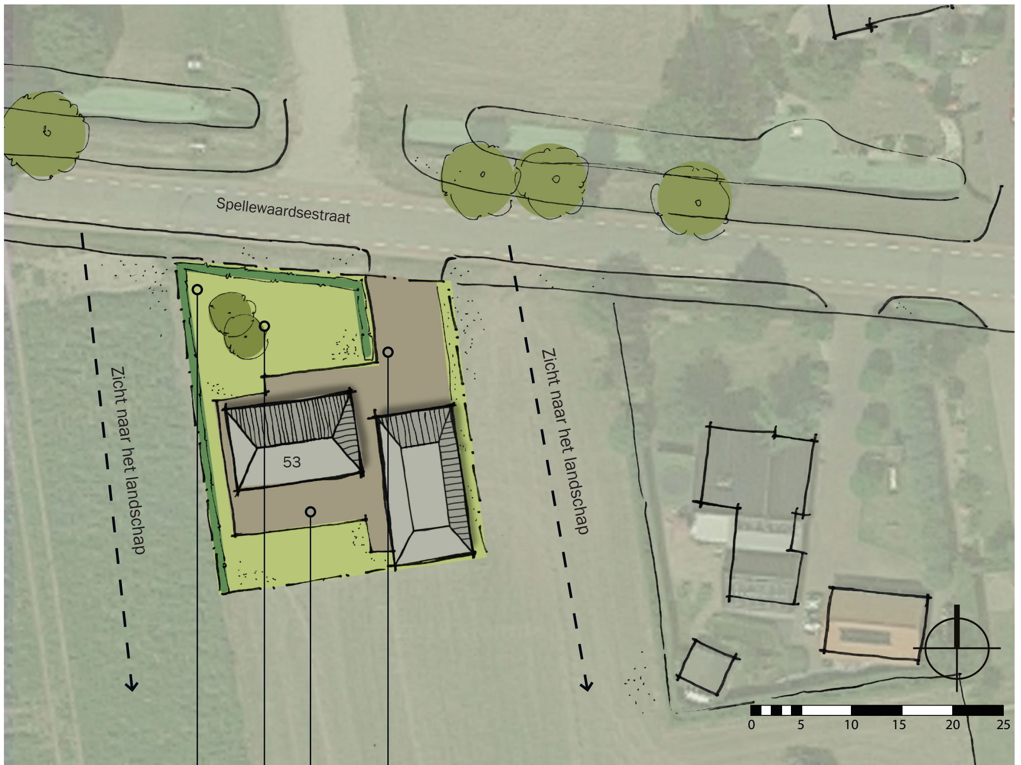
Inrichtingsschets nr. 53