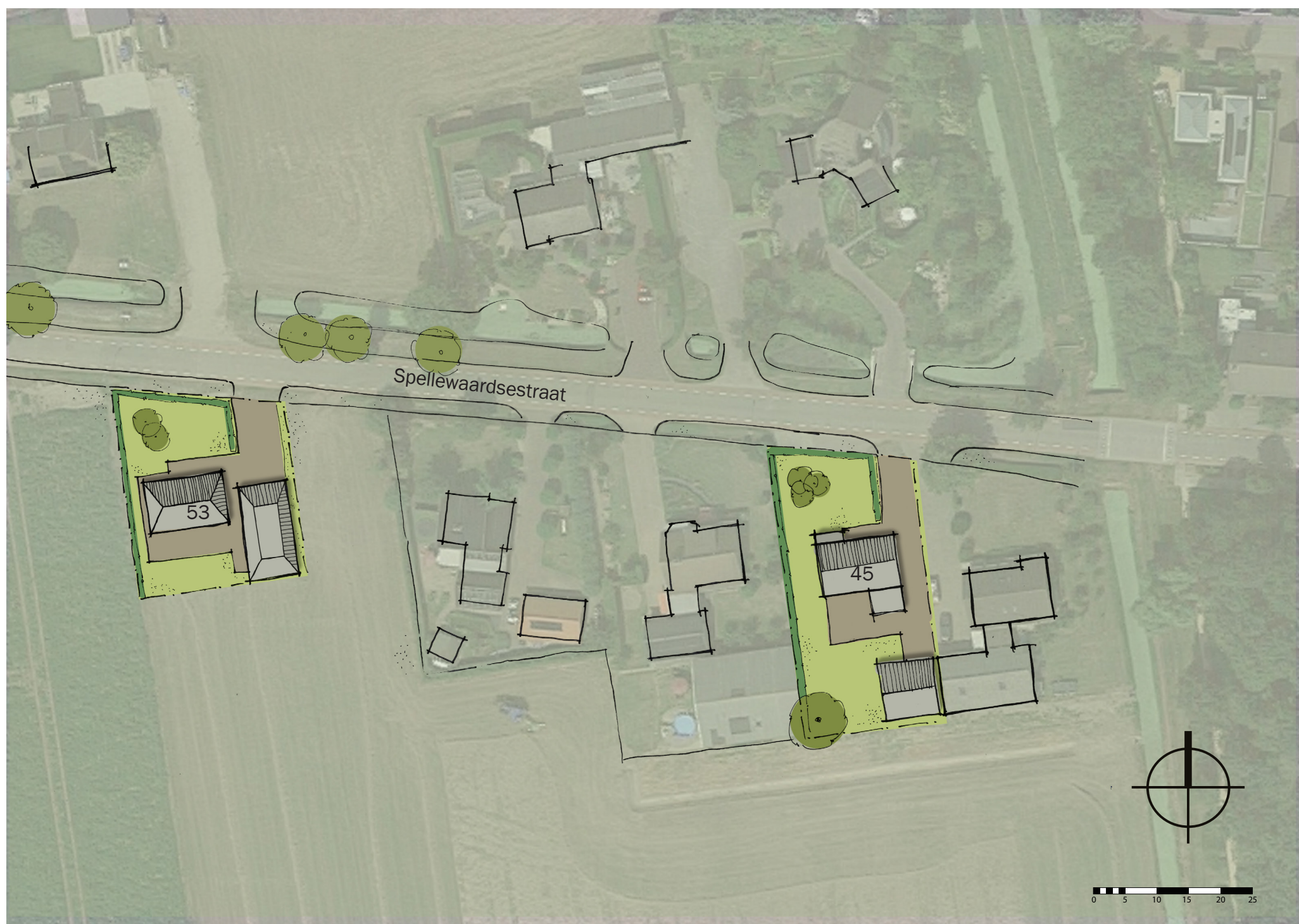
Overzicht beide percelen

Het de percelen bevinden zich in de Bommelwaard. Kenmerkend zijn de open agrarische gebieden en plantenkassen ten behoeve van de glastuinbouw. De verkaveling is bijna haaks op de rijbaan in de noord-zuid richting. De woningen aan de Spellenwaardseweg volgen voor een groot gedeelte deze richting. De voorgevelrooilijn ligt gemiddeld op 11 meter vanaf de rijbaan zodat er diepe voortuinen zijn ontstaan wat een groen karakter geeft.