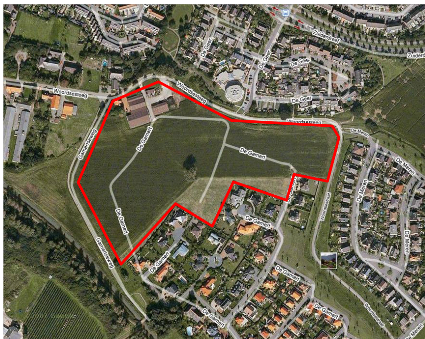
Globale begrenzing plangebied (rode omkadering)

In de onderstaande afbeelding is globaal de begrenzing van het plangebied aangegeven.