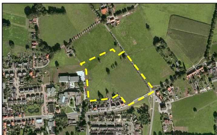
Figuur 1. De globale ligging van het plangebied

De globale ligging van het plangebied is weergegeven in de onderstaande figuur.