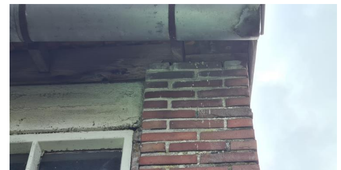
Figuur 9: Vogelpeepjes en opening in dakrand van noordwesthoek van bedrijfsopstal