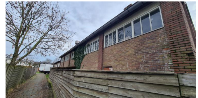
Figuur 6: Bedrijfsopstal gezien vanuit het noorden