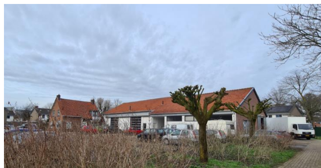
Figuur 8: Plangebied gezien vanuit het zuidoosten