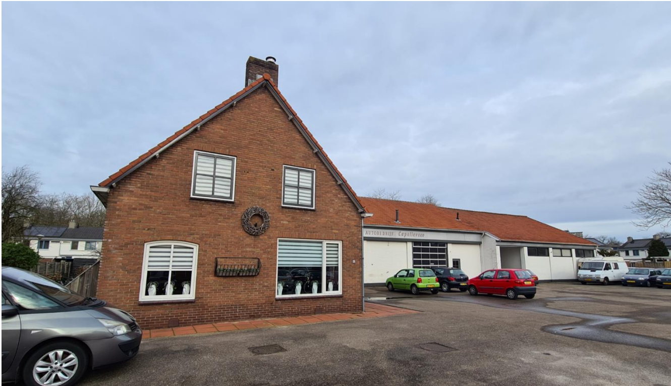
Figuur 4: Plangebied gezien vanaf de Haverlanden