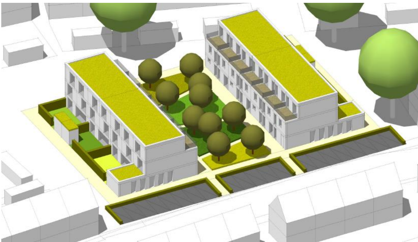
Figuur 3: Toekomstige situatie plangebied