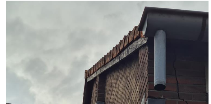
Figuur 5: Dakrand van de bedrijfsopstal