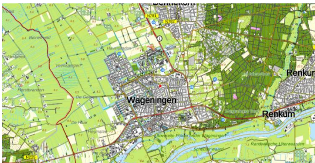
Figuur 1: Topografische kaart ligging plangebied (1:25.000)

De initiatiefnemer is voornemens de huidige bebouwing te slopen, en twee appartementencomplexen te realiseren. Per complex zijn 10 appartementen voorzien. Op de binnenplaats zal een groene openbare ruimte worden aangelegd. Figuur 3 geeft een beeld van de toekomstige situatie.