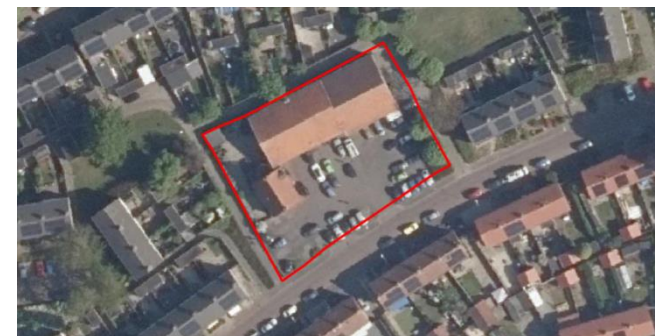
Figuur 2: Luchtfoto plangebied en directe omgeving