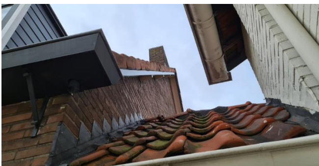
Figuur 7: Dakrand van het woonhuis