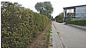
De Dreijenlaan met aan de rechter zijde museum Het Depot