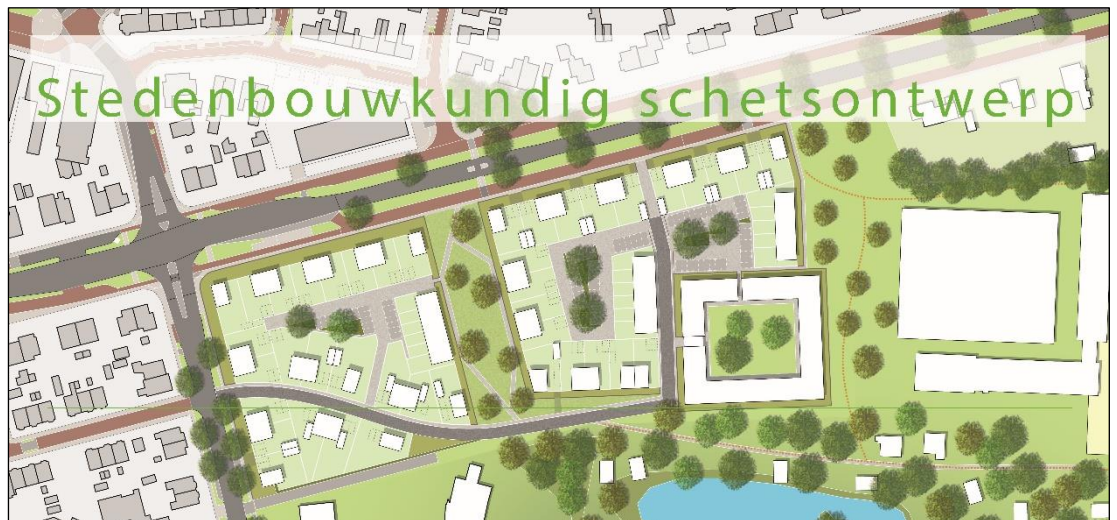
Het stedenbouwkundig schetsontwerp als resultaat van het participatietraject.

Het proces richting de totstandkoming van het stedenbouwkundig plan voor deze ontwikkeling is gestart met een intensief en innovatief participatietraject. In een drietal sessies is samen met de omgeving en andere stakeholders gewerkt vanaf een blanco vel en randvoorwaarden naar een uiteindelijk, door de mensen die hebben deelgenomen aan dit participatietraject, breed gedragen stedenbouwkundig plan. Het proces is in een eerste sessie begonnen met het ophalen van ideeën en wensen van de participanten. In de tweede sessie zijn deze ideeën en wensen verwoord tot globale uitgangspunten voor het plan, die met de participanten besproken zijn. De participanten hebben toen hun voorkeur uitgesproken voor de verschillende uitgangspunten. Op basis van deze voorkeuren zijn in de derde sessie twee planvarianten gepresenteerd. Op basis van de toen van de participanten gekregen reactie is uiteindelijk een eindplan (zie onderstaande afbeelding) gemaakt. Dit eindplan is op een extra vierde avond gepresenteerd en met zeer veel enthousiasme (applaus) ontvangen door de participanten.