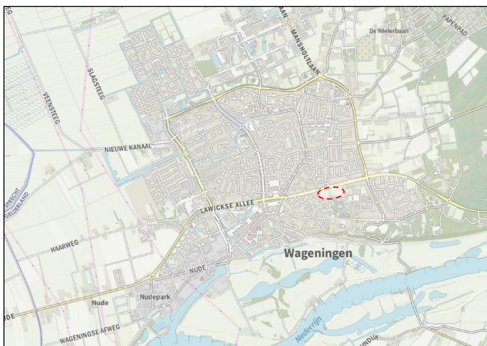
Globale ligging plangebied (rode cirkel) in Wageningen

Het plangebied is gesitueerd aan de oostzijde van Wageningen. Aan de noordzijde wordt het gebied begrensd door de Ritzema Bosweg, aan de oostzijde door de Vijverweg, aan de zuidzijde door universiteitsgebouwen en een botanische tuin en aan de westzijde door de Arboretumlaan. Op de navolgende afbeeldingen zijn de globale ligging en begrenzing van het plangebied weergegeven. Voor de exacte begrenzing van het plangebied wordt verwezen naar de verbeelding van dit bestemmingsplan.