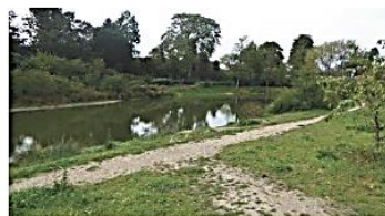
Vijver nabij het plangebied (onderdeel van Arboretum)