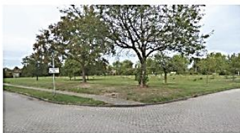
Zicht op het plangebied vanaf de kruising Dreijenlaan - Vijvenweg

De Dreijenborch en het Ritzema Boshuis zijn in 2009 gesloopt. Sinds de sloop zijn de gronden braakliggend en open van karakter, op enkele struweelhagen en bomen na. Deze gronden vormen de eerste fase van de herontwikkeling van de Dreijen en zijn het plangebied van voorliggend bestemmingsplan. De omgeving laat zich karakteriseren door de doorgaande Ritzema Bosweg aan de noordzijde, woonbuurten ten noorden en westen en de voormalige campus aan de oost- en zuidzijde. Belangrijk element op het campusterrein, welke in de toekomst grotendeels een andere bestemming zal krijgen, is het Arboretum: een botanische tuin, ooit behorend bij een landgoed en nu een openbaar stadspark. Ten slotte is een opvallend kenmerk van het plangebied het hoogteverschil: van circa 22,75 m + NAP tot 30 m + NAP (noordwest naar zuidoost)