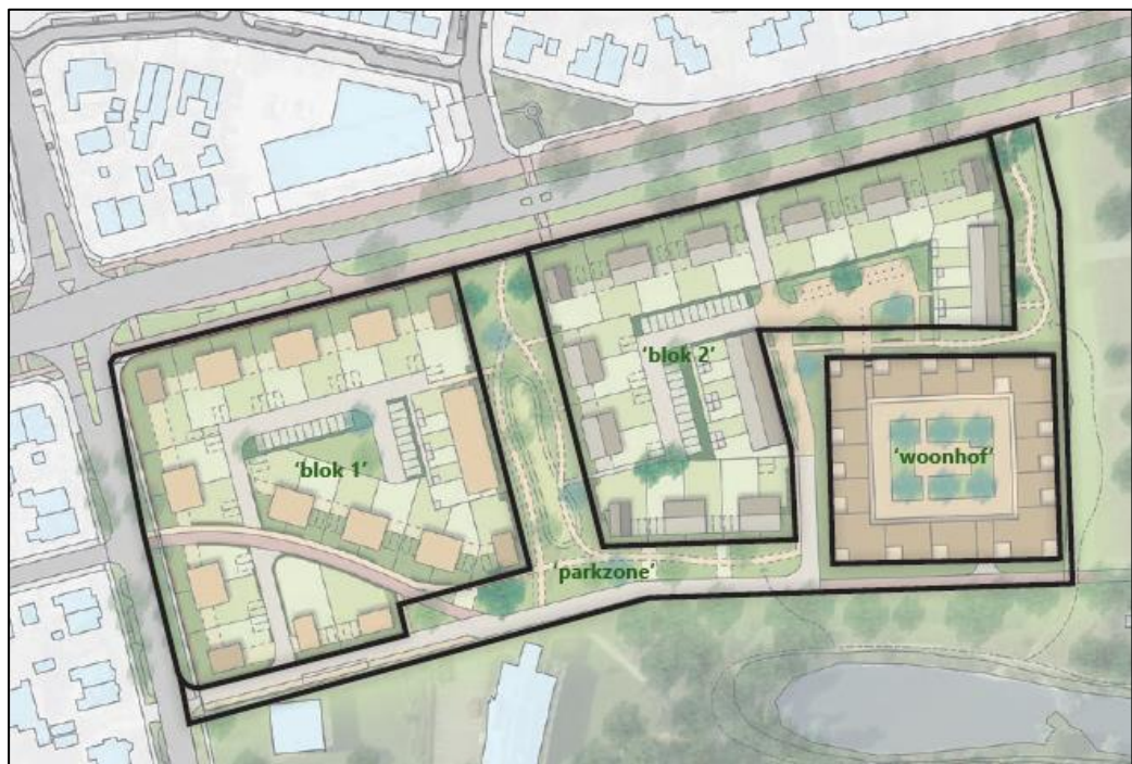
Weergave deelgebieden plangebied

De ontwikkeling bestaat uit drie bouwvelden. Elk blok, en ook het woonhof, krijgt een eigen architectonische verschijningsvorm. De bebouwing is uitgesproken in massa, ingetogen in materialisatie en optimaal verweven met de groene omgeving.