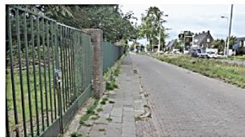
Hekwerk langs de Ritzema Bosweg