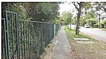
De rand van het plangebied ter hoogte van de Arboretumlaan