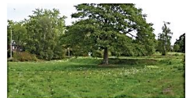
Groene uitstraling van het gebied met hoogteverschillen

Impressies huidige situatie plangebied en omgeving