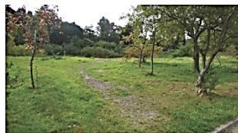
Het plangebied heeft een groen karakter