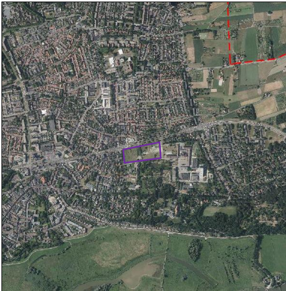
Uitsnede van de risicokaart externe veiligheid met paarse aanduiding ontwikkellocatie.