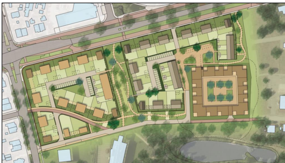
Stedenbouwkundig schetsontwerp fase 1 De Dreijen te Wageningen

Voor de locatie De Dreijen, een voormalig universiteitsterrein, bestaat het voornemen een herontwikkeling tot stand te brengen richting een woon-, werk- en leefgebied voor de inwoners van Wageningen. De gehele ontwikkeling wordt beoogd in minimaal twee fases. De eerste fase behelst de realisatie van maximaal 80 woningen. Deze 80 woningen kunnen op basis van het ter plaatse geldende bestemmingsplan niet gerealiseerd worden. Daarom wordt voor de locatie een nieuw bestemmingsplan opgesteld. In het kader van de te doorlopen planologische procedure moet aangetoond worden dat de voorgenomen ontwikkeling in lijn is met een 'goede ruimtelijke ordening'. Om de haalbaarheid van deze ontwikkeling aan te tonen dient onder meer getoetst te worden aan het aspect externe veiligheid. Deze memo gaat in op het aspect externe veiligheid met betrekking tot de voorgenomen ontwikkeling.