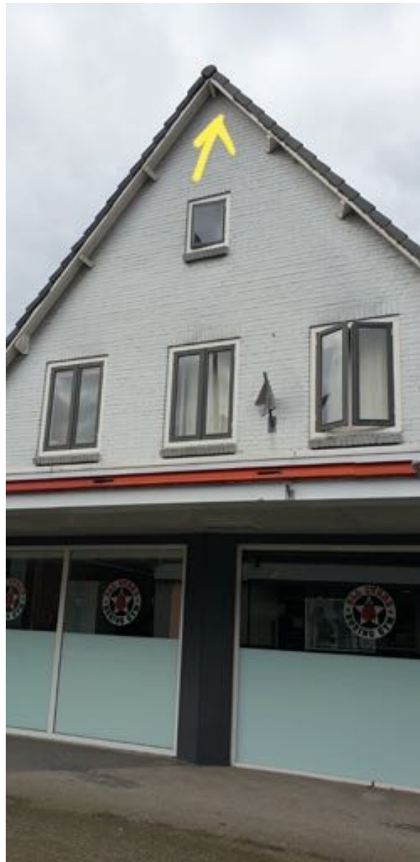
Locatie 3: aan de voorzijde van Churchillweg 27 zijn in de nok sporen van vleermuizen aangetroffen.