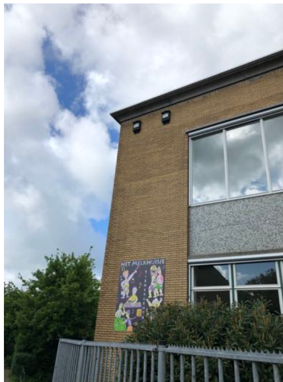
2 kleine vleermuiskasten aan de oostgevel van Churchillweg 39. Geen bezetting geconstateerd.