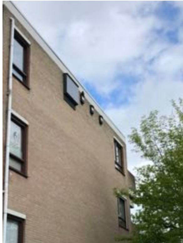
3 kleine vleermuiskasten en 1 kraamkast aan de oostgevel van Harnjeshof. Geen bezetting geconstateerd.