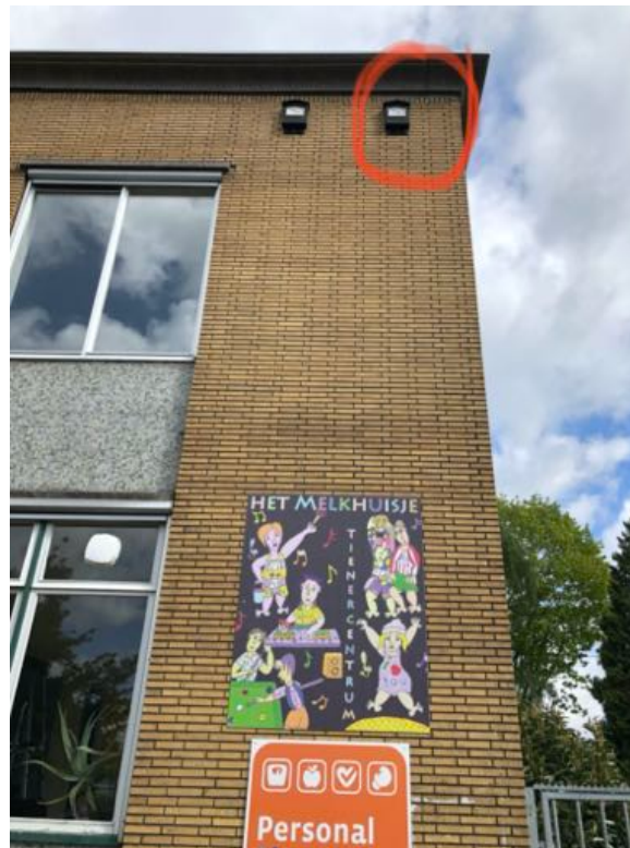
2 kleine vleermuiskasten aan de zuidgevel van de Churchillweg 39 te Wageningen. In de rood omcirkelde kast is tijdens een inspectie in 2020 een vleermuis aangetroffen.