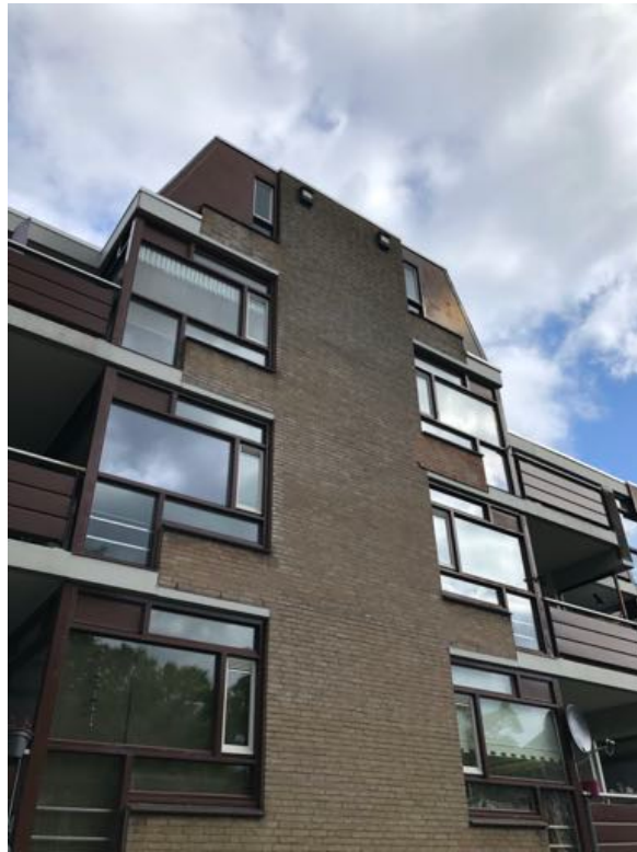
2 kleine vleermuiskasten aan de zuidgevel van de Harnjeshof aan de Spelstraat.