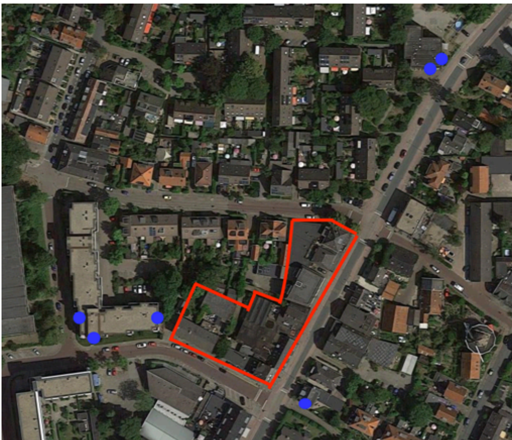
Locaties van geplaatste vleermuiskasten. De rode omlijning betreft het plangebied. De blauwe stippen geven weer waar vleermuiskasten zijn geplaatst.

Hieronder volgt een plattegrond met de geplaatste kasten.