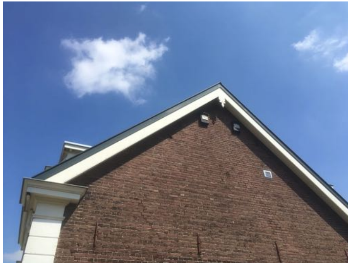
2 kleine vleermuiskasten aan de zuidgevel van de Churchillweg 30.