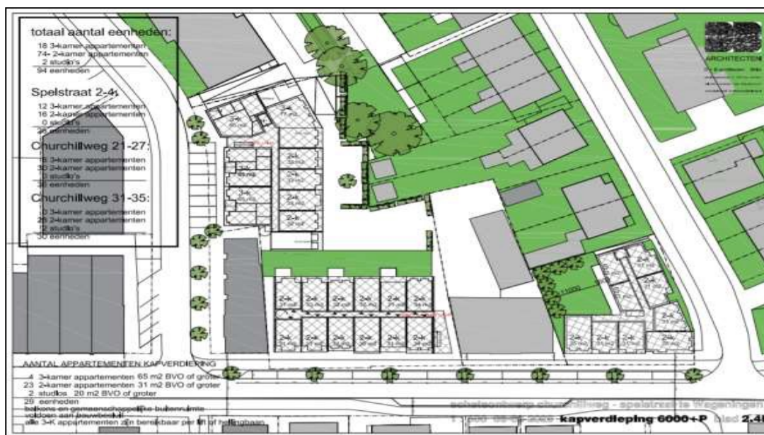
Figuur 1. Ligging van het plangebied (rood omlijnd) aan de Spelstraat 2-4, Churchillweg 23-25, 27 en 31-35 (afbeelding boven). Het terrein wordt ontwikkeld tot een nieuw appartementencomplex met 90 appartementen inclusief parkeerplaatsen (afbeelding onder).