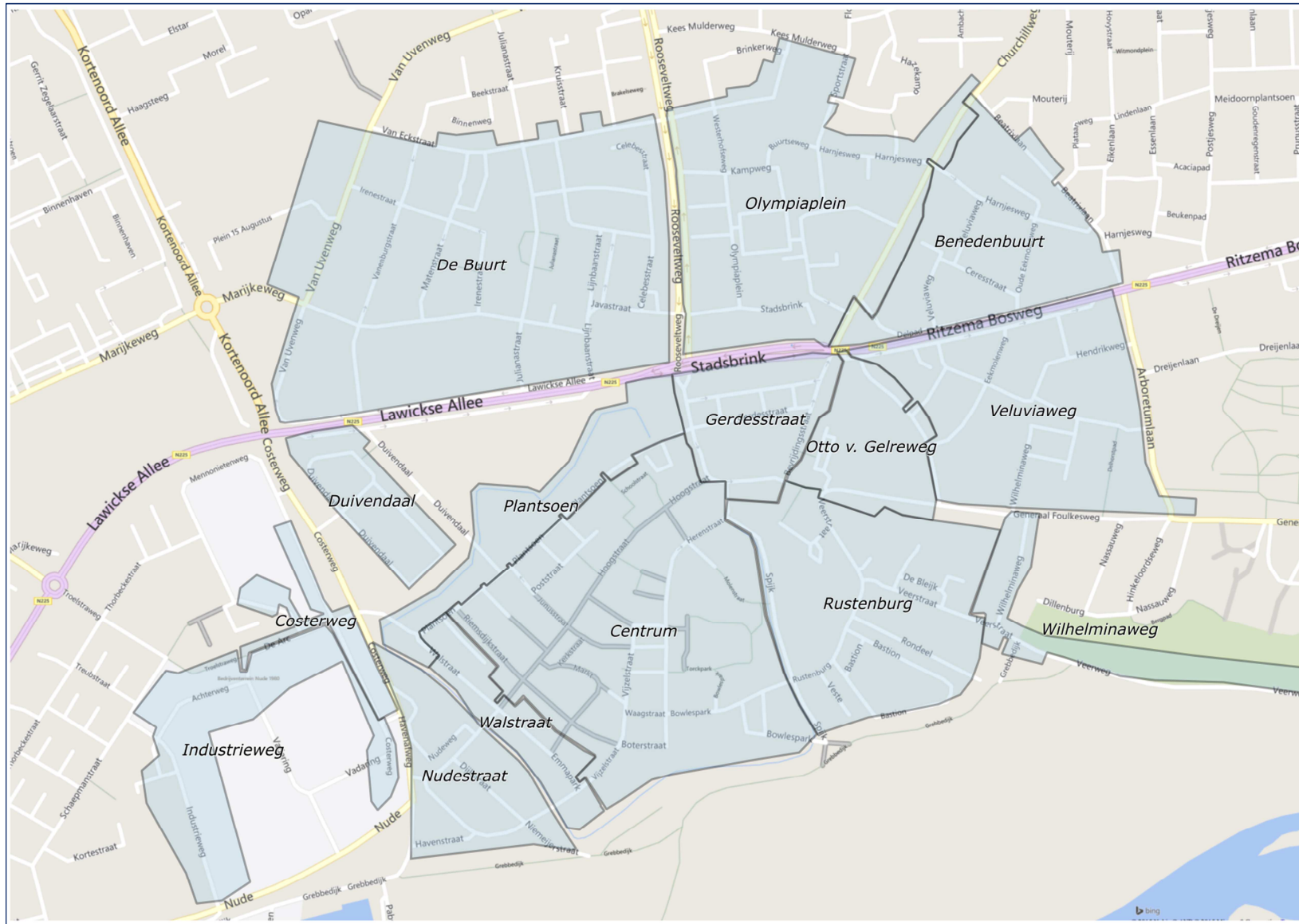
figuur 1 deelgebieden