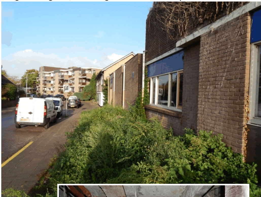
Plangebied: laagbouw, winkel en groenstrook. Inzet: kruipruimte