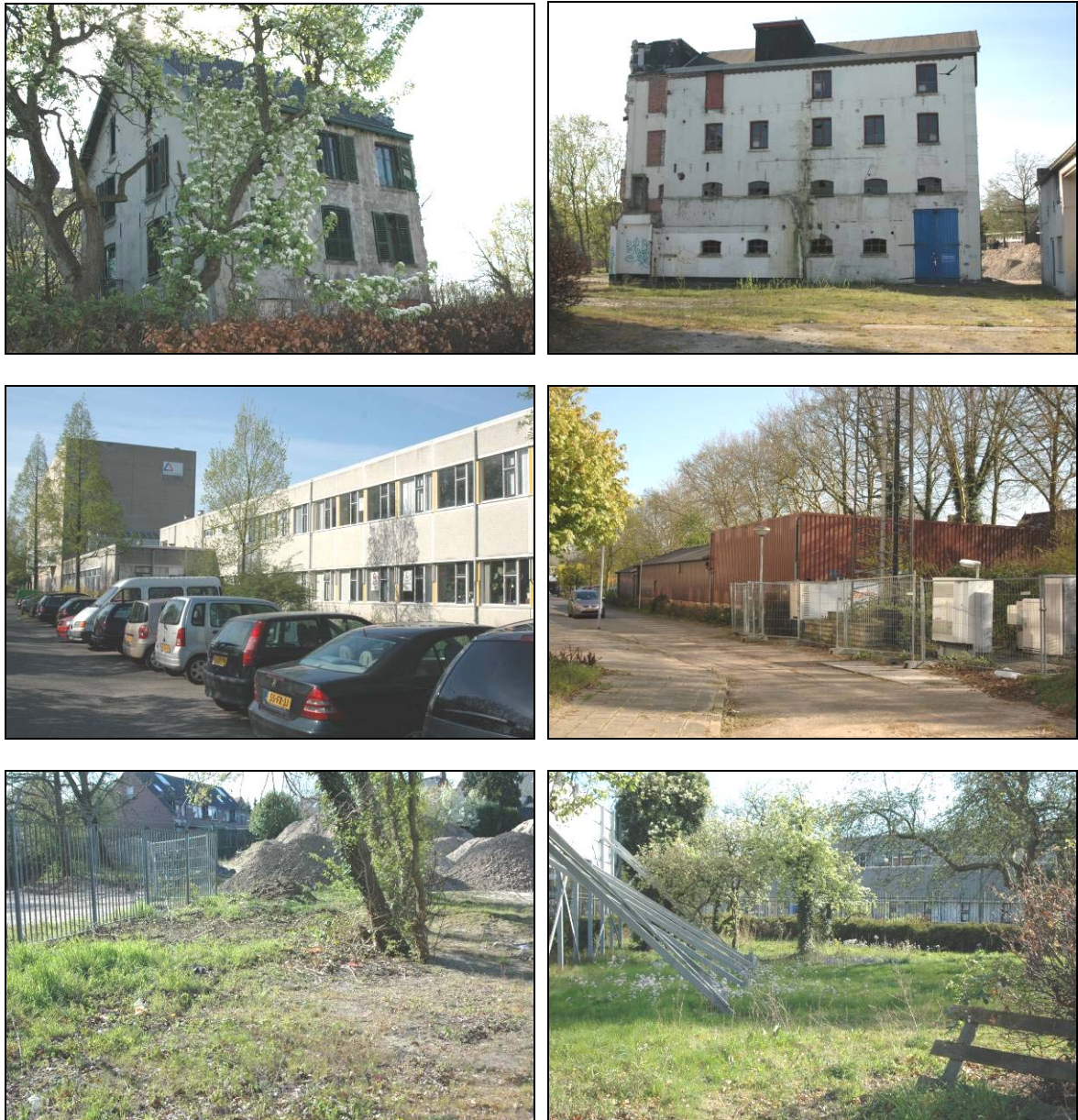
Figuur 2. Foto-impressie van de inbreidingslocatie te Wageningen.