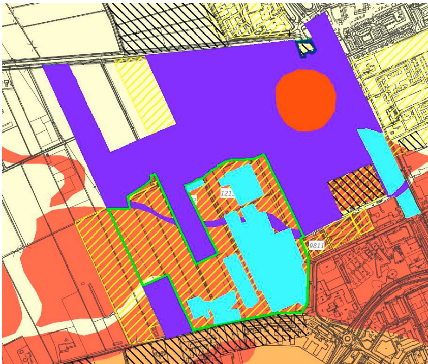
Figuur 2: uitsnede gemeentelijke archeologische kaart met binnen bestemmingsplangrenzen ingekleurde gebieden.

Rode cirkel = dubbelbestemming 'waarde- archeologie';