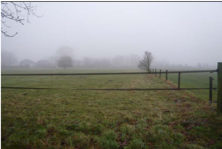
Foto b3.2 Overzicht onderzoekslocatie vanuit westelijke richting