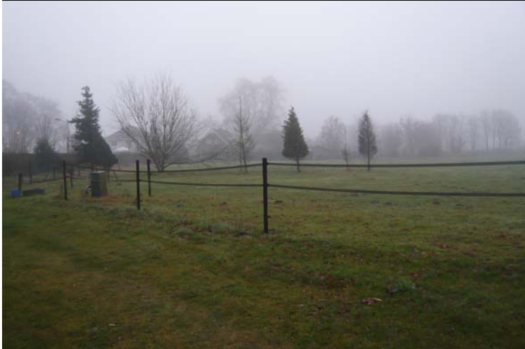
Foto b3.1 Overzicht onderzoekslocatie vanuit noordelijke richting