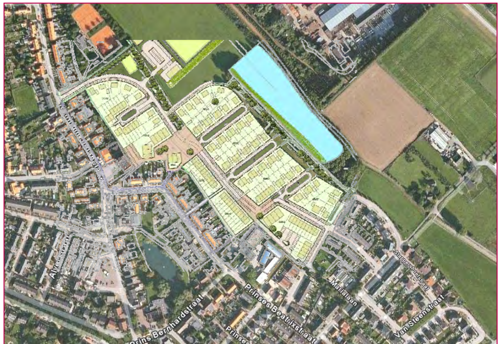
Figuur 1.1: Het nieuwe stedenbouwkundige plan en de omliggende straten

In Ooij, gemeente Ubbergen, werkt Oosterpoort Projectontwikkeling mee aan de verplaatsing van de sportvelden van SVO ten behoeve van de bouw van circa 150 woningen op deze locatie. De ontsluiting van het nieuwe woongebied vraagt daarbij om bijzondere aandacht. Figuur 1.1 geeft een weergave van het plan.