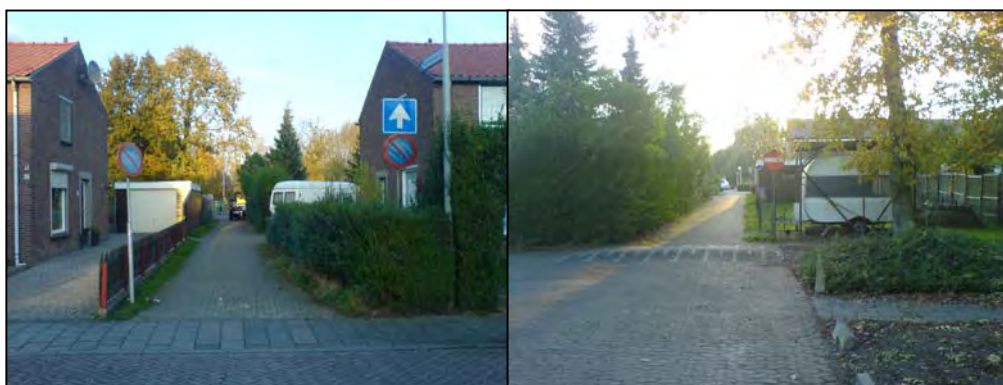
Figuur 2.1: De toegang halverwege de Prinses Beatrixstraat, tussen huisnummers 33 en 35

Het plangebied is in de huidige situatie toegankelijk via een tweetal doorsteekjes vanaf de Prinses Beatrixstraat.