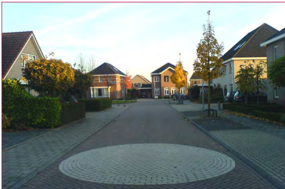
Foto 4.1: Ronde verkeersdrempel in de Van de Venstraat

Onze conclusie is dat er geen intensiteiten ontstaan die te hoog zijn voor de straten. Ook voor kinderen blijft er een goede situatie bestaan. Het is uit oogpunt van veiligheid wel van belang dat de snelheden laag blijven.