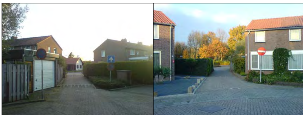
Figuur 2.2: De uitgang in de bocht van de Prinses Beatrixstraat, tussen de huisnummers 17 en 19

Beide doorsteekjes zijn smal, er is juist voldoende ruimte om er met een auto doorheen te rijden. Een trottoir ontbreekt. De achtertuinen van de woningen aan de Prinses Beatrixstraat zijn ook op deze manier bereikbaar. Beide ontsluitingen zijn door de geringe breedte ongeschikt als auto-ontsluiting voor de nieuwe woningen: het is niet mogelijk om een trottoir in te passen.