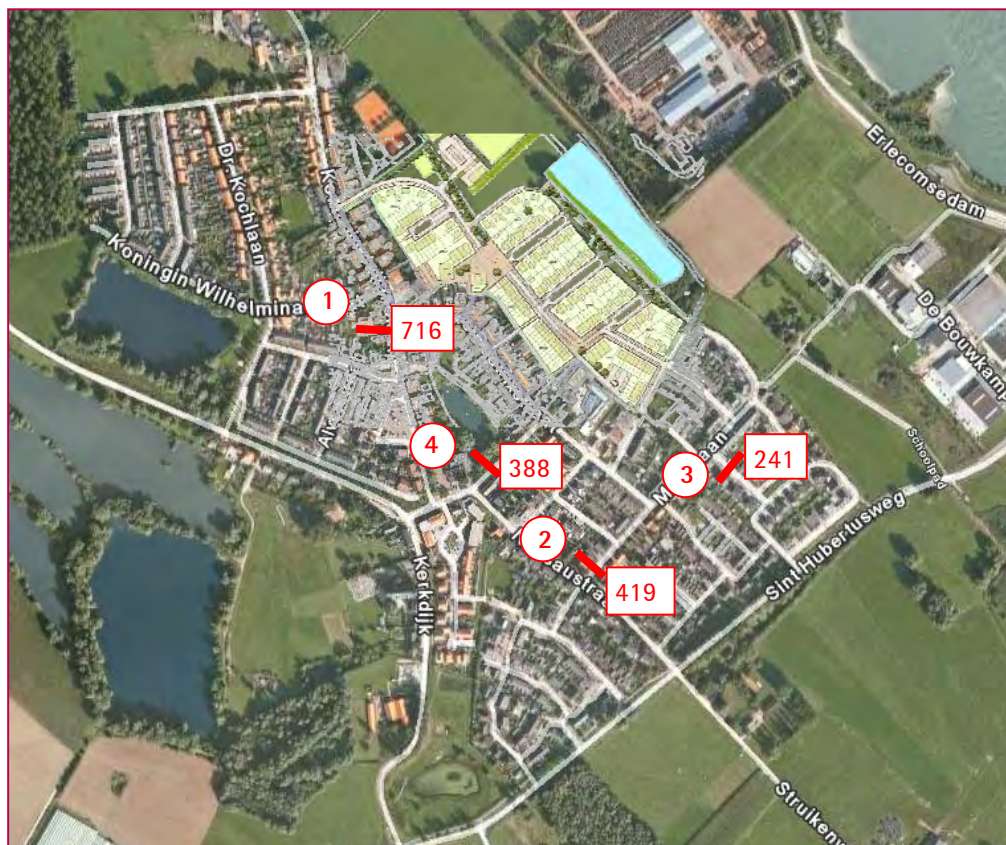
Figuur 3.1: Telpunten met de etmaalintensiteiten

Figuur 3. geeft de ligging van de telpunten weer. Tabel 3.1 geeft een overzicht van de resultaten uit het verkeersonderzoek.