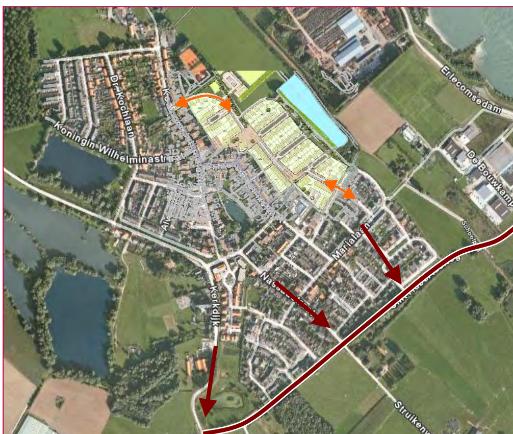
Figuur 4.1: Het stedenbouwkundig ontwerp in de omgeving met de belangrijkste rijrichtingen voor het autoverkeer

Het plan bestaat uit zo'n 150 woningen, op de locatie van de huidige voetbalvelden van SVO. De nieuwe voetbalvelden komen meer in noordelijke richting te liggen.