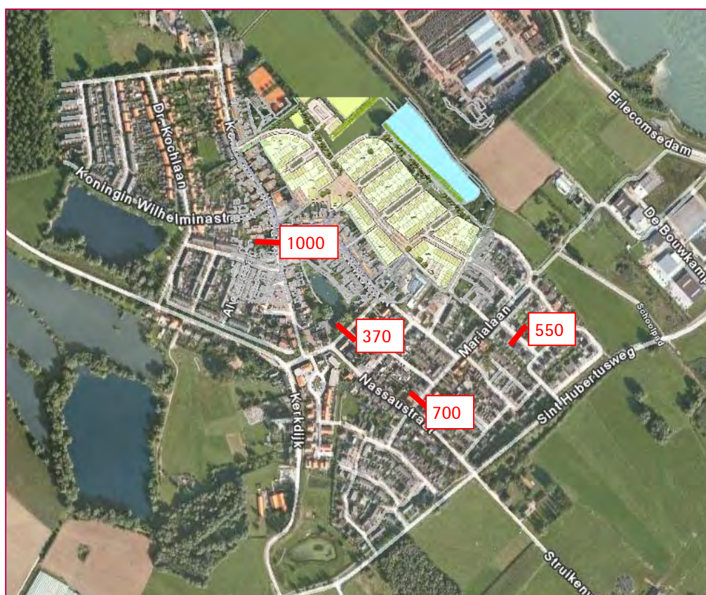
Figuur 4.2: De toekomstige etmaalintensiteiten

Het grootste deel van het verkeer zoekt een route richting de Sint Hubertusweg. Gezien de ligging van de woningen verwachten wij dat een derde van het verkeer de nieuwe buurt zal verlaten via de Julianalaan en twee derde via de aansluiting op de Marialaan. Dus zo'n 250 à 350 ritten richting de Julianalaan en zo'n 500 à 650 ritten over de Marialaan. Op de Marialaan kan het verkeer kiezen of het de weg vervolgt richting Nassaustraat of richting de Van de Venstraat en Van Steenstraat. Onze verwachting is dat beide routes ongeveer gelijkwaardig gebruikt worden. Figuur 4. geeft de toekomstige intensiteiten weer.