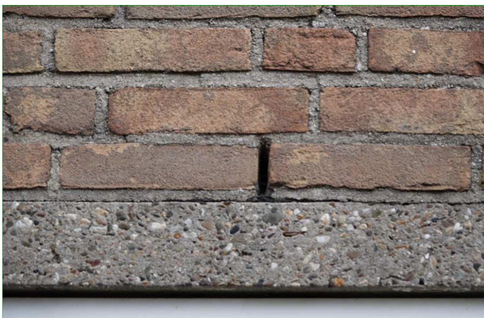
Open stootvoeg in een van de muren. Vleermuizen kunnen via de open stootvoegen de spouwmuur inkruipen om te verblijven.