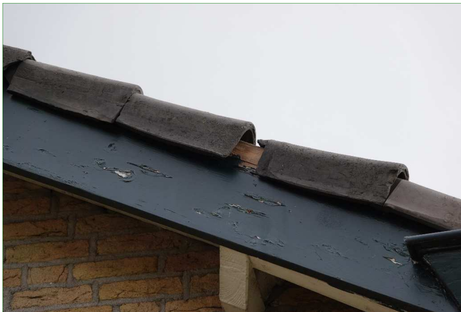
Ruimte onder dakpannen bieden mogelijk geschikte verblijfplaatsen voor Huimus, Gierzwaluw en vleermuizen.

Het is mogelijk dat het plangebied incidenteel wordt gebruikt als onderdeel van het leefgebied van in de buurt vastgestelde vogelsoorten met jaarrond beschermde nesten zoals Roek, Sperwer of Buizerd.