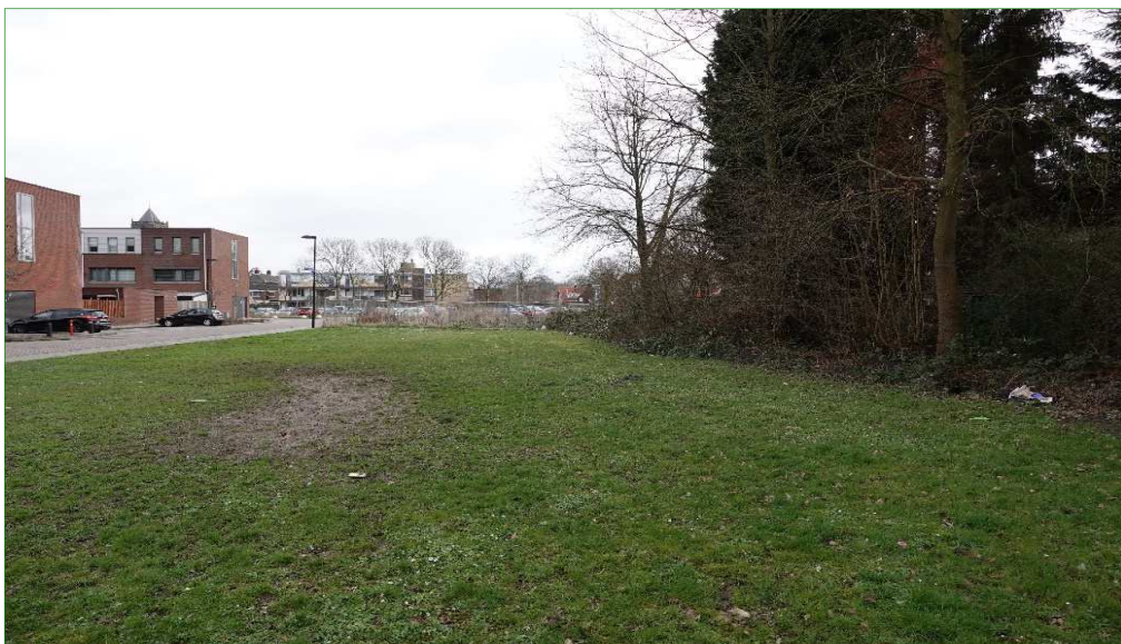
De noordzijde van het plangebied bestaat uit bosschages en een grasveld dat grenst aan een woonwijk.