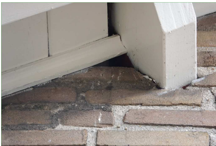
Holte tussen muur en dak waar Gierzwaluwen gebruik van zouden kunnen maken. Op de muur zijn witte poepstrepen zichtbaar.