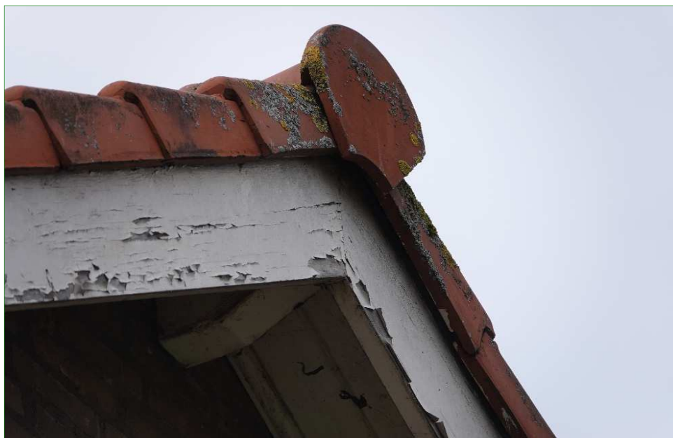
Ruimte onder nokpan en nokvorsten waar mogelijke vleermuizen naar binnen kunnen kruipen om achterliggende ruimten te bereiken.

Gezien de ligging, de vorm en de grootte van het plangebied kan geen sprake zijn van een belangrijke functie als vliegroute voor vleermuizen.