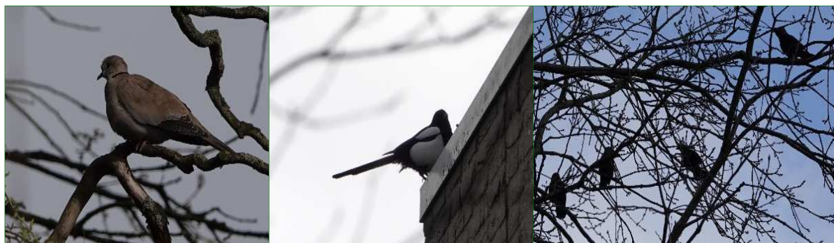
Tijdens het veldbezoek zijn diverse vogelsoorten aangetroffen waaronder Turkse tortel, Ekster en Kauw.

In het plangebied worden geen roofvogels en uilen met jaarrond beschermde nesten verwacht. Er is geen geschikt broedbiotoop en geschikt leefgebied voor roofvogels en Steenuilen aanwezig, zoals hoge bomen in een bosrijke of voor Steenuilen geschikte broedplekken als steenuilkasten of holtes in bijvoorbeeld oude knotwilgen. Het plangebied is gelegen op een druk binnenstedelijk gebied en daarnaast zijn geen waarnemingen bekend van deze soorten in het plangebied en de directe omgeving. Ook werden geen sporen (in de vorm van poepstrepen, braakballen of prooiresten) gevonden die wijzen op gebruik door dergelijke roofvogels en uilen.