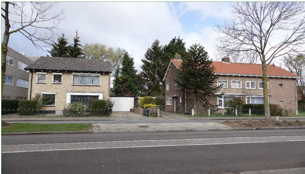
De zuidzijde van het plangebied bestaat uit voortuinen en drie woningen en ligt aan de Nieuwe Tielseweg. .

Zowel aan de voorzijde als aan de achterzijde van de woningen zijn tuinen met sierbeplanting aanwezig.