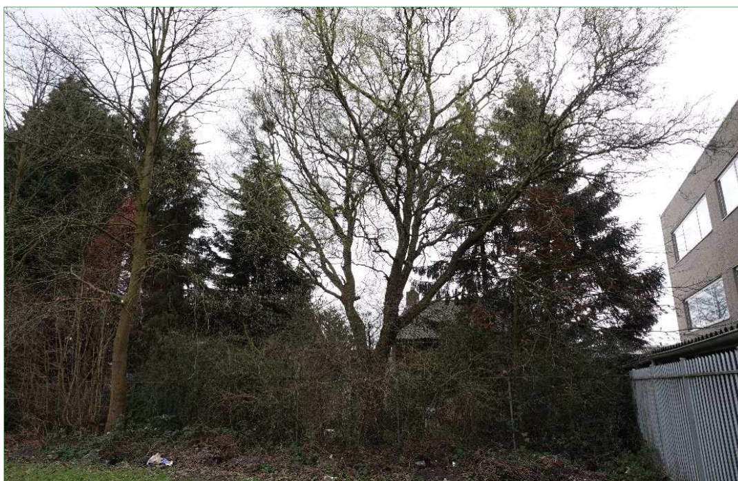
In de achtetruinen staat verschillende hoge bomen. In één van de bomen is een Eksternest aanwezig.

Aan de noordzijde van het plangebied ligt een strook soortenarm, voedselrijk grasland. Hier groeien soorten als Madeliefje, Paarse dovenetel en Zachte ooievaarsbek. Daarnaast is er veel mos aanwezig. Het grasland wordt, gezien de grote hoeveelheid uitwerpselen, voornamelijk gebruikt als hondenuitlaatplaats.