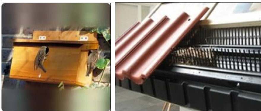
Figuur 3 Impressie van nestmogelijkheden voor de Huismus.