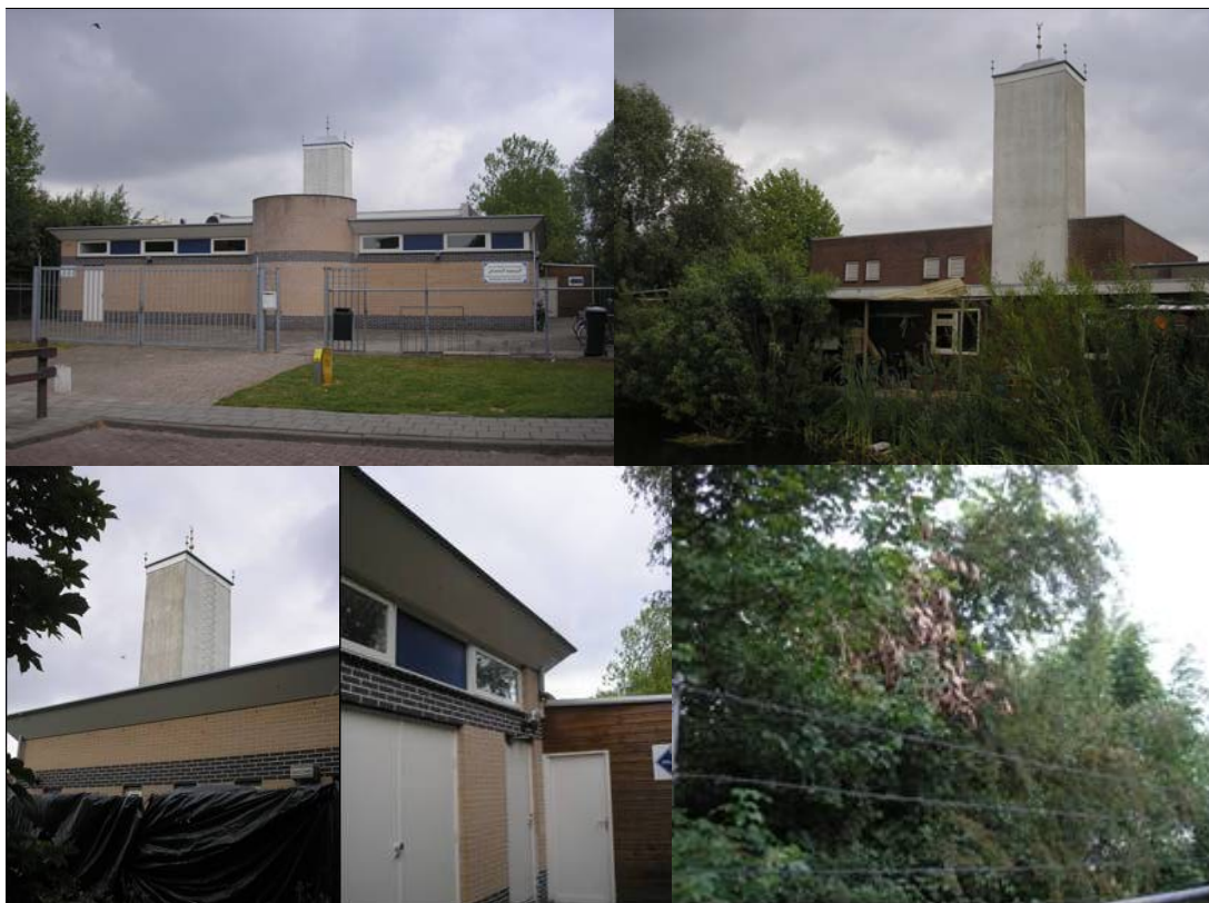
Figuur 2 Foto-impressie van de planlocatie. Linksboven: Voorzijde van moskee aan Tieleraardlaan Rechtsboven: Achterzijde van moskee gelegen langs watergang Linksonder: Linkerzijde van moskeegebouw Middenonder: Detail van rechterzijde van moskeegebouw Rechtsonder: Groenstructuur rondom moskeeterrein.