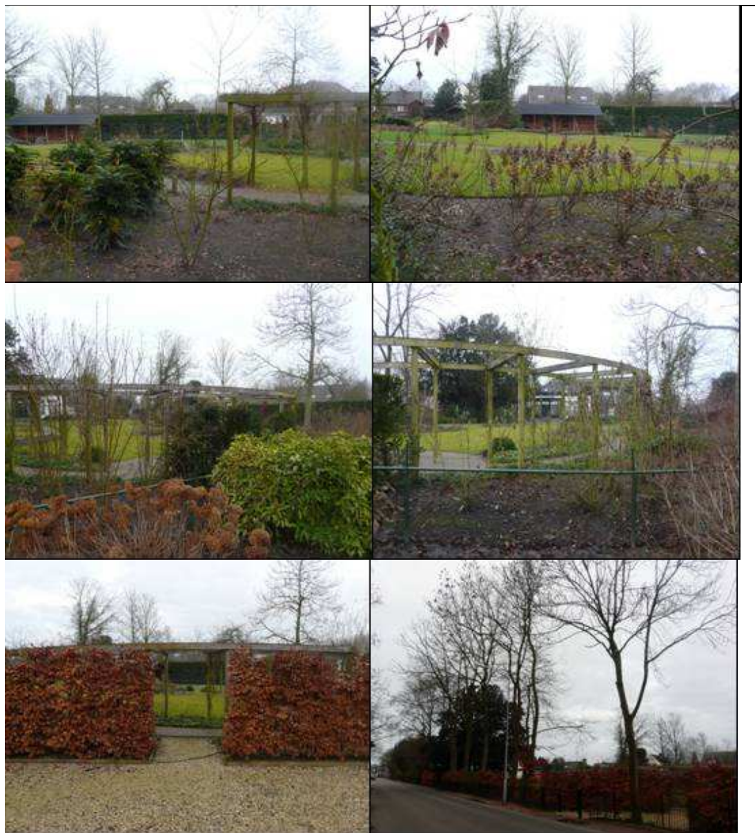
Figuur 2.2 Foto-impressie van het plangebied. Linksboven : Zicht vanaf zuidzijde op het perceel met struiken, grasveld, betegeling en pergola. Rechtsboven : Zicht vanaf zuidzijde op het perceel met struiken, grasveld en tuinhuis (valt buiten grens van plangebied). Middenlinks : Zicht vanaf zuidoostzijde op het perceel met pergola, struiken en hekwerk. Middenrechts : Zicht vanaf oostzijde op het perceel met hekwerk, tuinplanten en pergola. Linksonder : Zicht vanaf oostzijde op het perceel met grind, beukenhaag en daarachter de tuin. Rechtsonder : Burgemeester Meslaan met de beukenhaag en bomenrij aan de rand van het perceel.