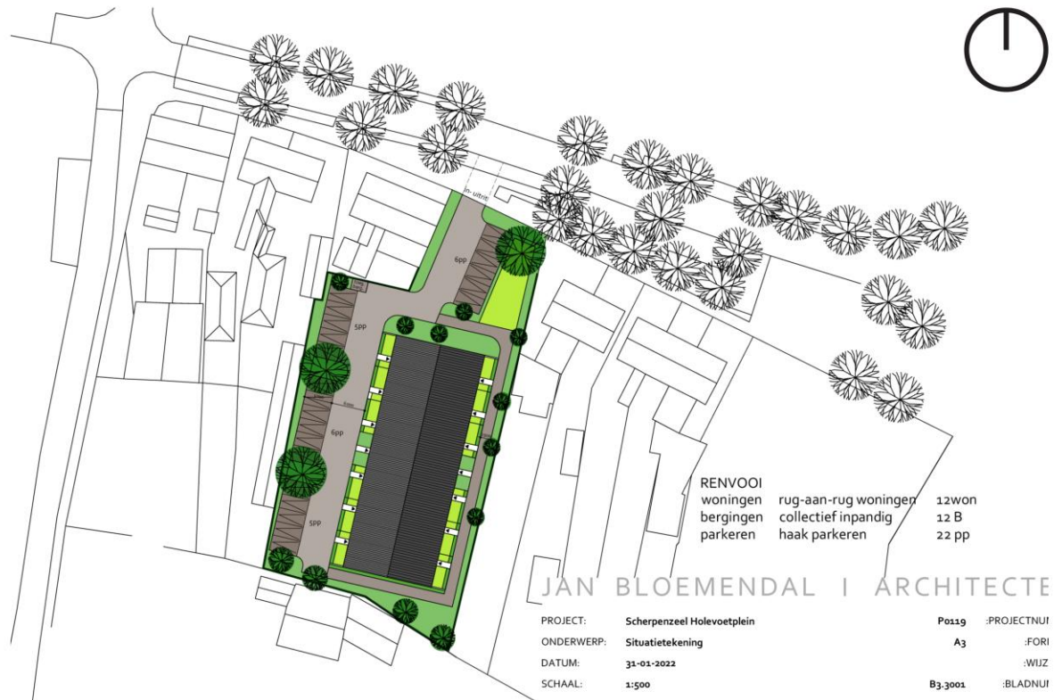
Afb. 1. Situatie herbestemming

ADC ArcheoProjecten heeft in opdracht van Koppel Holding B.V. voorliggende adviesmemo opgesteld met betrekking tot de noodzaak tot archeologisch onderzoek voor percelen aan het Holevoetplein 294-296 te Scherpenzeel (afb. 1). De opdrachtgever is voornemens om daar 12 rug-aan-rug woningen zonder kelder te ontwikkelen, waarvoor een projectprocedure ten behoeve van een wijziging in het bestemmingsplan is opgestart. Deze adviesmemo bestaat uit een toetsing van de impact van de geplande werken op mogelijk aanwezige archeologische waarden zoals die op basis van eerder archeologisch onderzoek worden verwacht.