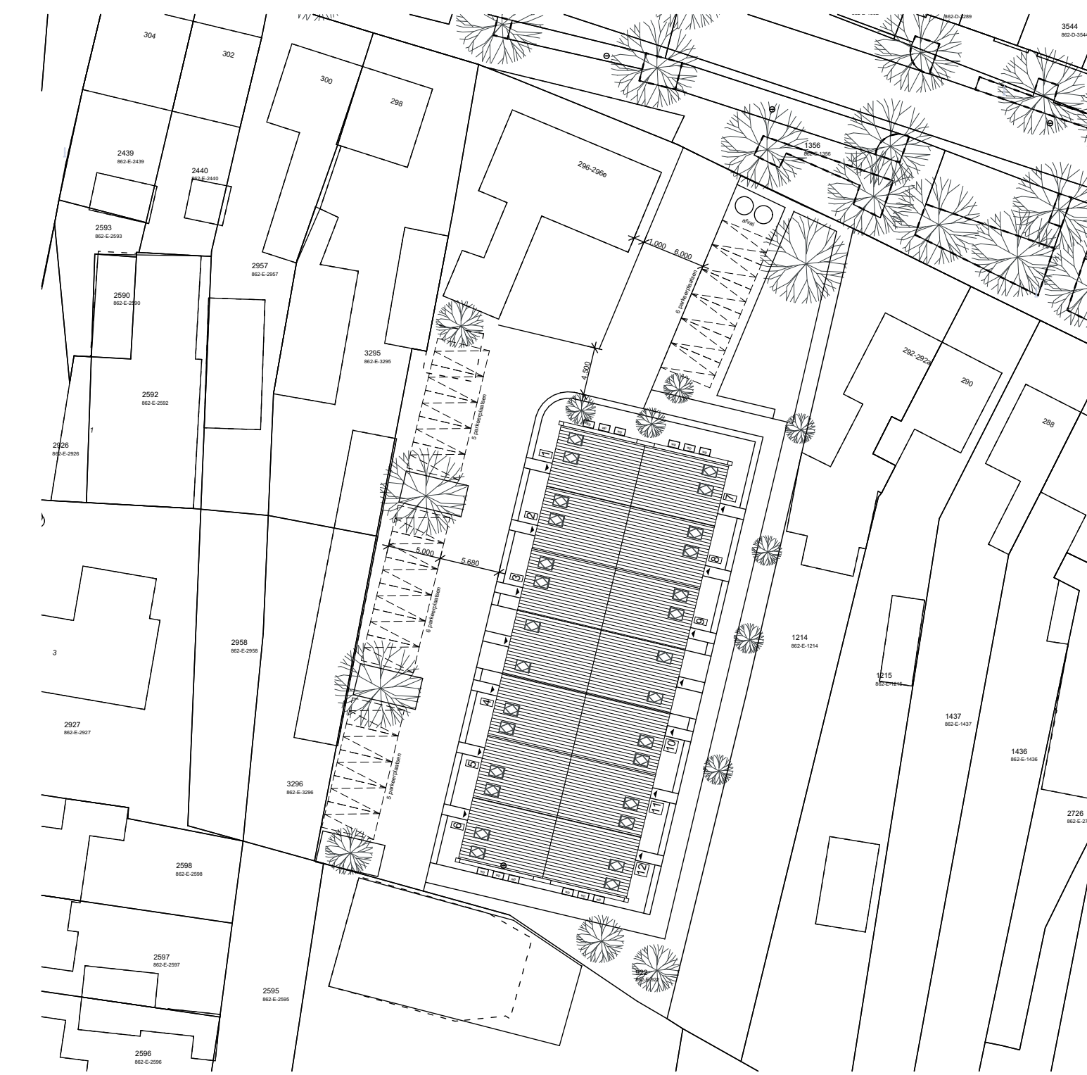
Situatie schaal 1:500