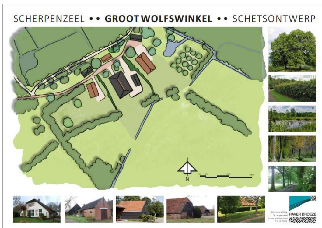
Afbeelding 1: schetsontwerp Groot Wolfswinkel 1

Aangezien het aantal inzetbare sloopmeters net onvoldoende is om te kunnen voldoen aan de voorwaarden uit de wijzigingsbevoegdheid (artikel 3.7.1 lid c van het bestemmingsplan Buitengebied), wordt maatwerk toegepast. In dat kader is overeen gekomen dat het tekort aan sloopmeters (79m 2 ) wordt gecompenseerd met natuurmaatregelen in de vorm van de aanleg van een nieuwe amfibieënpoel in de noordoosthoek van het perceel (zie afbeelding 1). De bestaande bomen in dit deel van het terrein blijven behouden. In dit memo worden de ontwerputgangspunten beschreven voor deze poel.