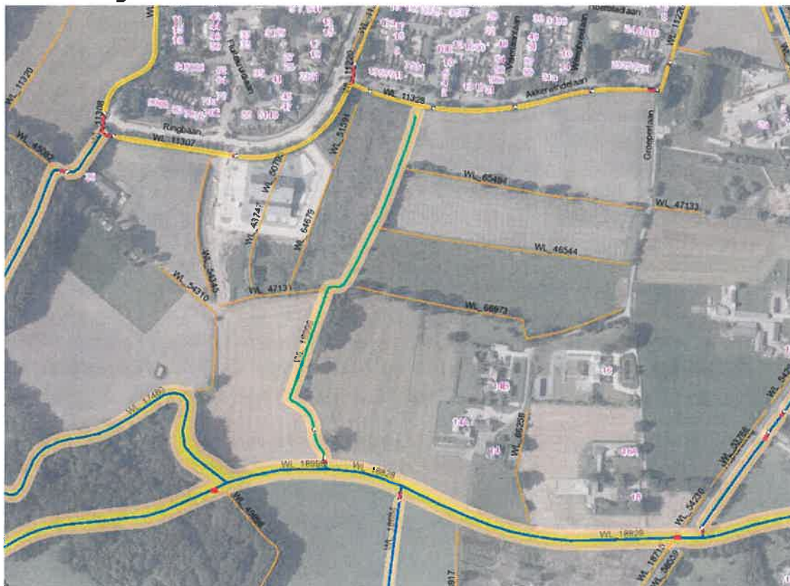
Uitsnede Waterlegger Gelderse Vallei (2017)

Binnen het plangebied is geen bebouwing of verhard oppervlak aanwezig. De gronden binnen het plangebied zijn volledig onverhard en agrarisch in gebruik. Het hemelwater kan in de huidige situatie rechtstreeks in de bodem infiltreren.