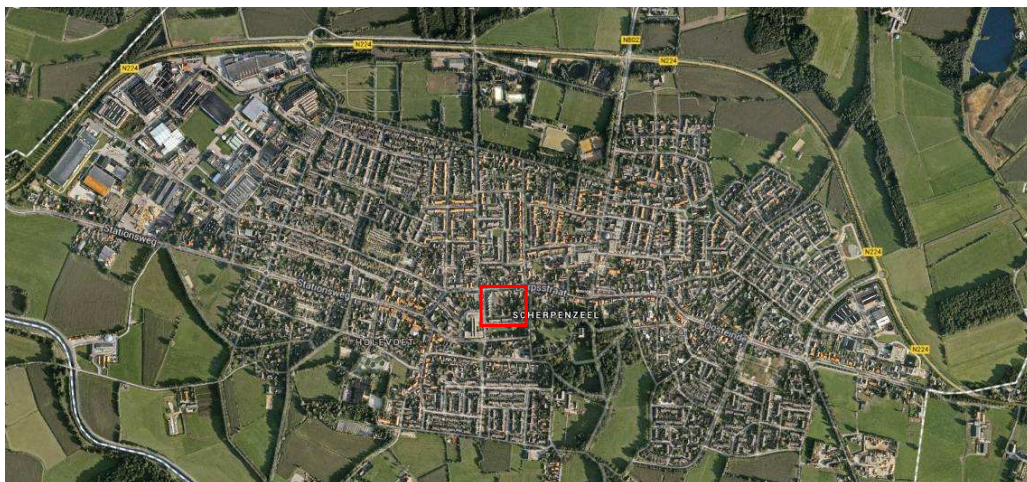
Figuur 1.1. Begrenzing plangebied.

Het plangebied is centraal gelegen in Scherpenzeel. Het plangebied bestaat uit verschillende gebouwen, waaronder een discountsupermarkt en enkele woonhuizen. Tevens zijn achtertuinen en openbaar groen aanwezig. In Figuur 1.1 is de ligging van het plangebied ten opzichte van Scherpenzeel weergegeven. In Figuur 1.2 is de bebouwing aangegeven die ten behoeve van onderhavig onderzoek onderzocht is.