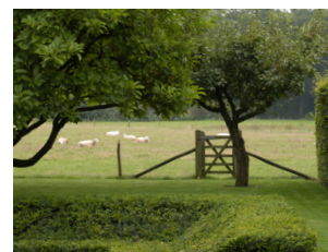
Relatie met landschap