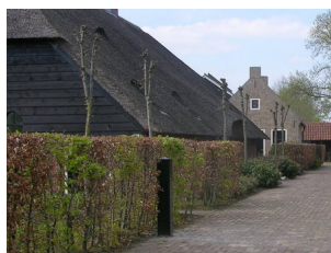
Haag rondom karakteristieke boerderij