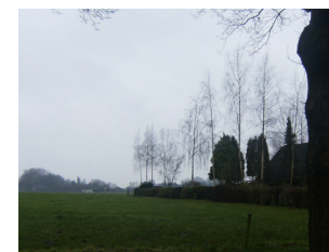
Zicht richting spankeren