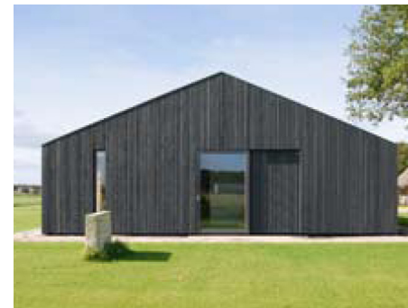
karakter nieuwbouw passend op boerenerf