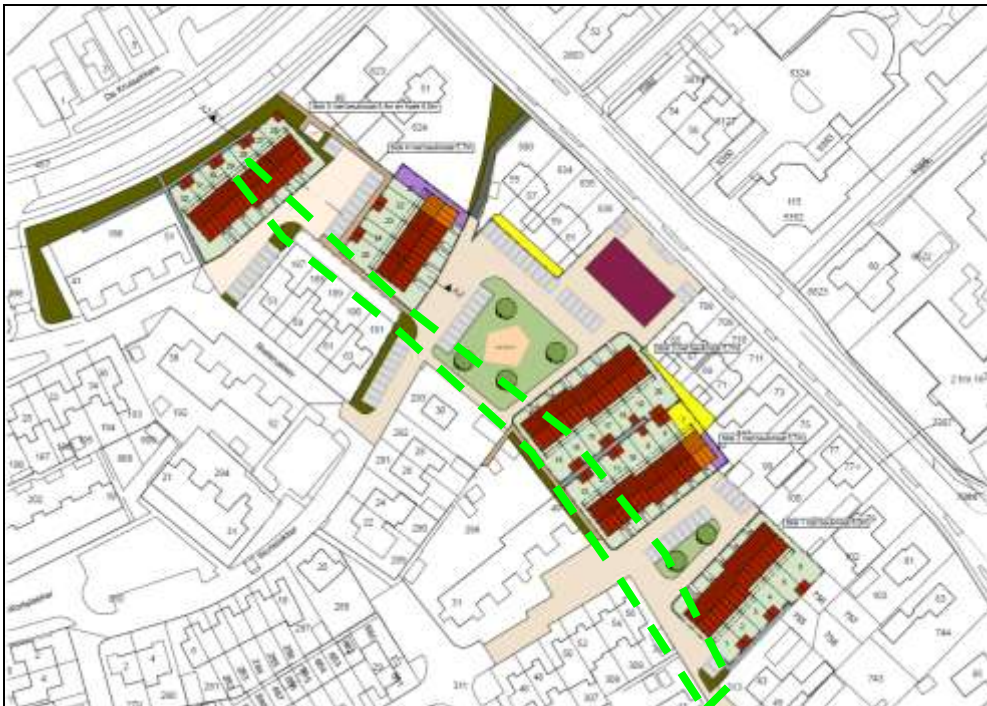
In de bovenste afbeelding is de ligging plangebied (rood) met bomenrij (groen kader) weergegeven. De onderste afbeelding toont de nieuwe inrichting en de contour (groen gestreept) waar de bomenrij aanwezig was.