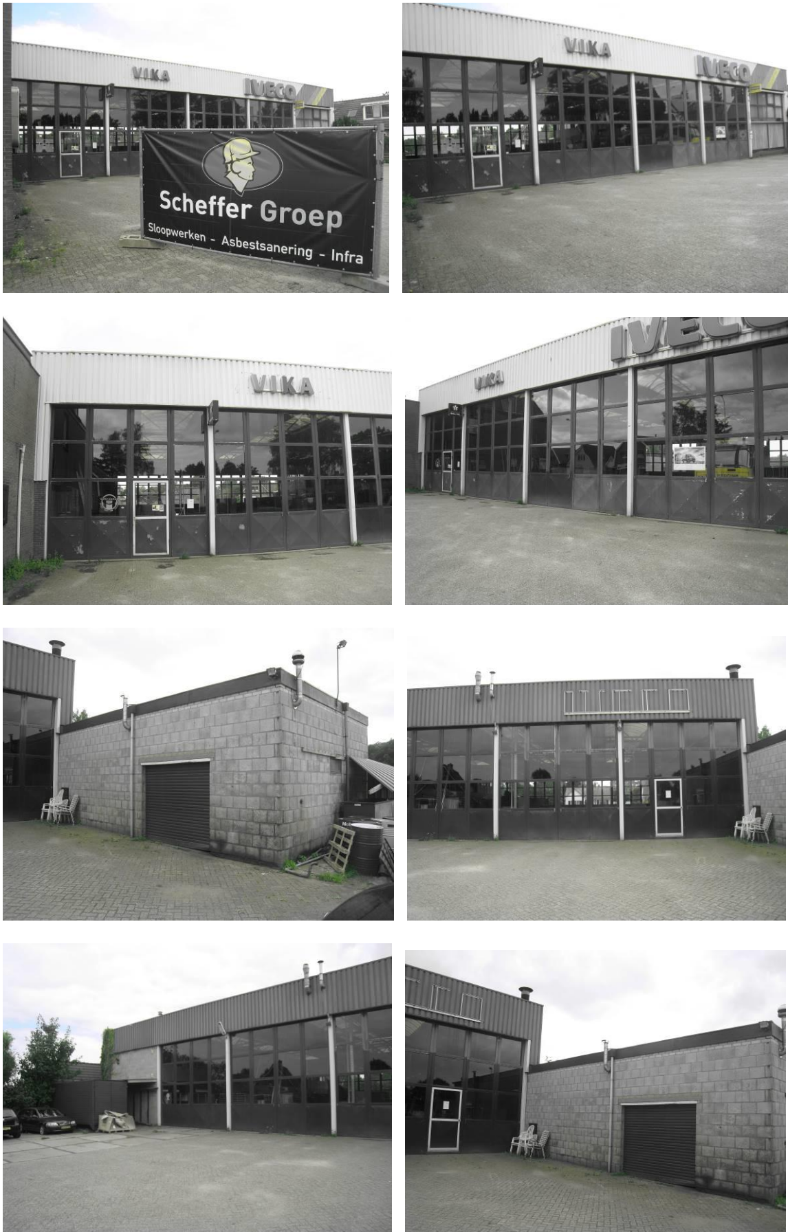
Figuur 2. Aanzicht van het plangebied Zuiderzeestraat 680 te Hattermerbroek.