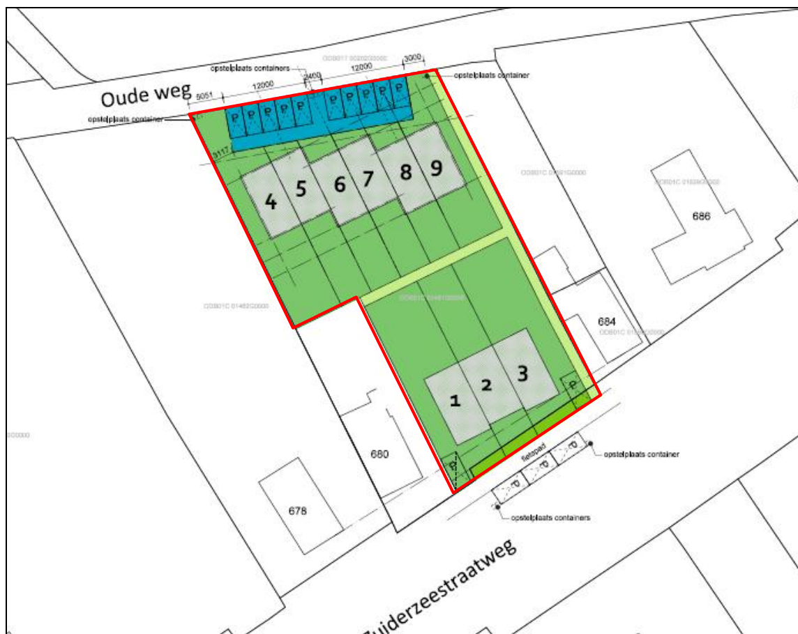
Figuur 3. Impressie van de plannen Zuiderzeestraat 680 te Hattemerbroek.