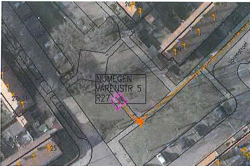
Kaststation, afmeting 200x100x200 cm, bestemming "Groen"

en regelstation binnen de bovengenoemde bestemming te koppelen aan de functieaanduiding 'nutsvoorziening' op de verbeelding en de daarbij behorende veiligheidscontour (Barim - zone). Door deze wijze van bestemmen is de aanwezigheid van het gasdrukmeet- en regelstation voor derden zichtbaar en wordt beter geborgd dat de veiligheidsafstanden ten opzichte van respectievelijk kwetsbare objecten en beperkt kwetsbare objecten nu en in de toekomst in acht worden genomen.