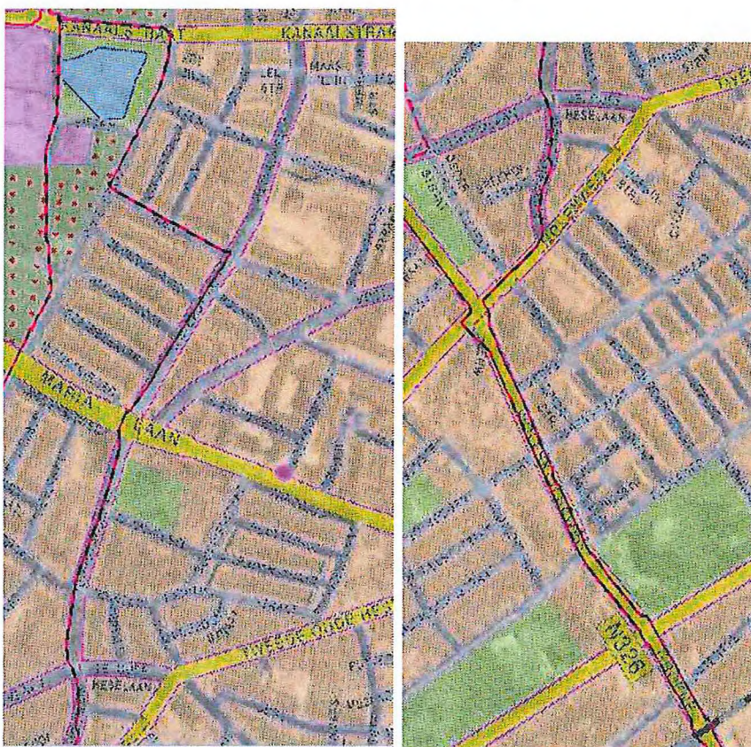
Ligging 50 kV-kabelverbindingen

Wij verzoeken de gemeente het ontwerp zodanig aan te passen dat aan de gronden, waarin de 50kV-kabelverbindingen zijn gelegen een dubbelbestemming wordt toegekend, voorzien van passende bouwregels en een omgevingsvergunningstelsel voor het uitvoeren van een werk of werkzaamheden, ter bescherming van de verbinding.