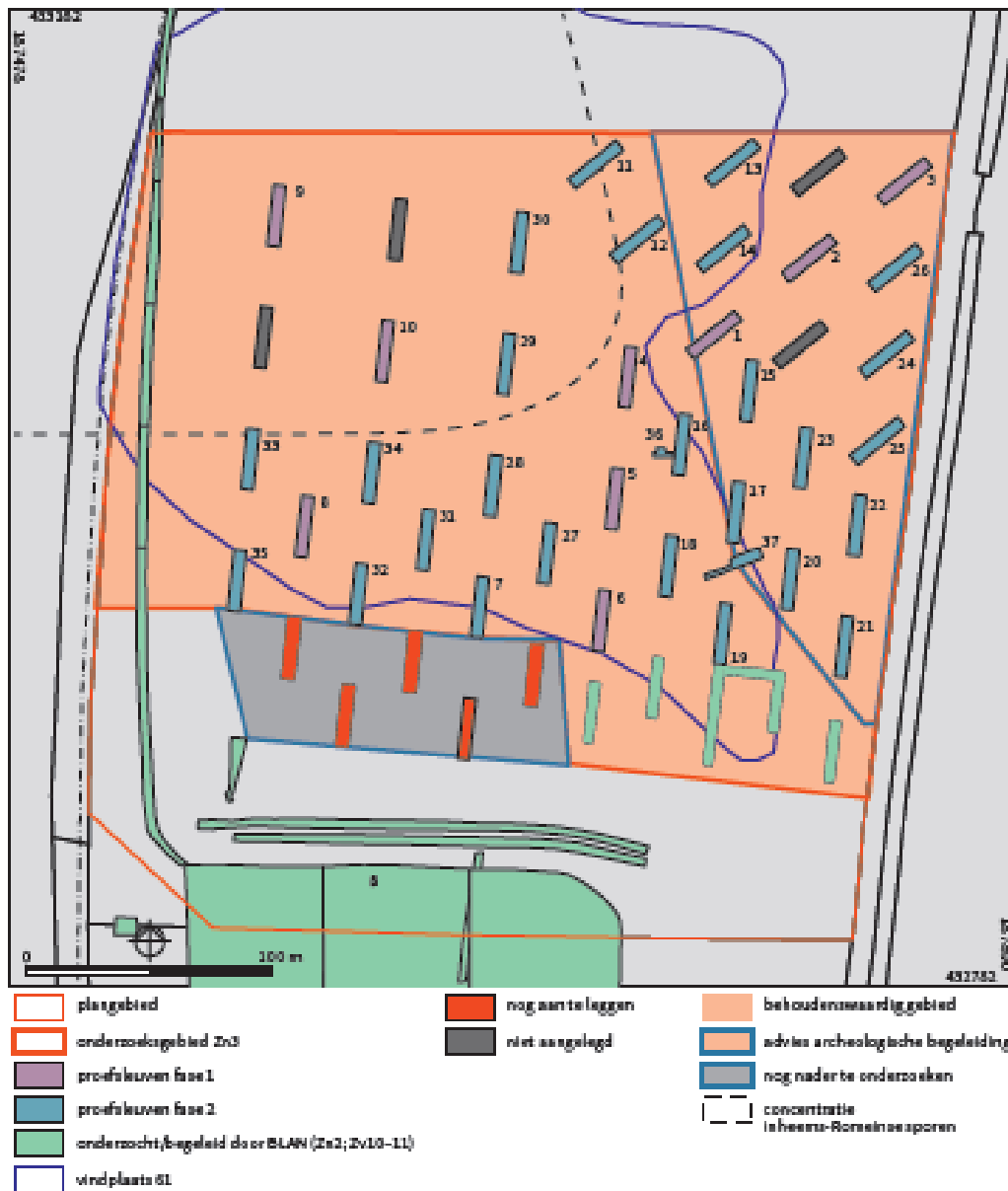
Figuur 7.1. Zone met behoudenswaardige resten.