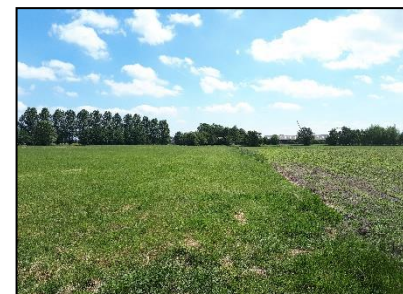
Figuur 13. Grasland in noordwesthoek van onderzoekslocatie 1, gezien vanuit het westen.