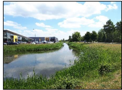
Figuur 16. Watergang in noorden van onderzoekslocatie 2, gezien vanuit het westen.