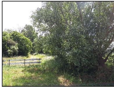
Figuur 15. Bosschage op noordwesthoek van onderzoekslocatie 1, gezien vanuit het noordwesten.