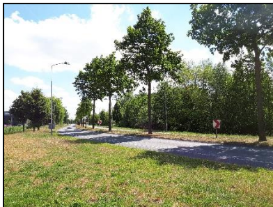
Figuur 17. Bomenrij langs noorden van onderzoekslocatie 1, gezien vanuit het noordwesten.