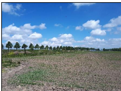
Figuur 11. Maïsakker langs de westelijke rand van onderzoekslocatie 1, gezien vanuit het zuidwesten.