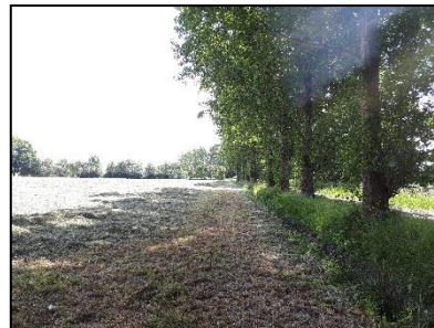
Figuur 18. Populierenrij langs de Doornsteeg op noordelijke helft van onderzoekslocatie 1, gezien vanuit het noordwesten.