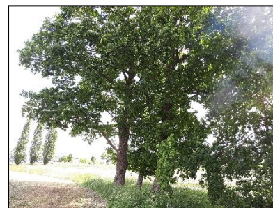
Figuur 21. Bomen in noordoosthoek van onderzoekslocatie 1, gezien vanuit het westen.