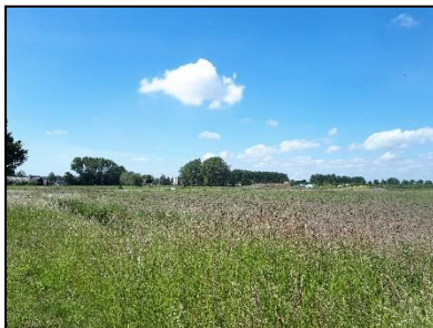
Figuur 5. Zuidelijke helft van onderzoekslocatie 1, gezien vanuit het noordoosten.