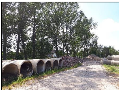
Figuur 8. Bouwmaterialen langs rij populieren op zuidelijke deel van onderzoekslocatie 1, gezien vanuit het westen.