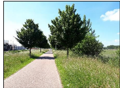
Figuur 4. Bomenlaan langs de oostzijde van onderzoekslocatie 1, gezien vanuit het noorden.