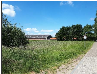
Figuur 3. Meest noordelijke boerderij, gezien vanuit het oosten.