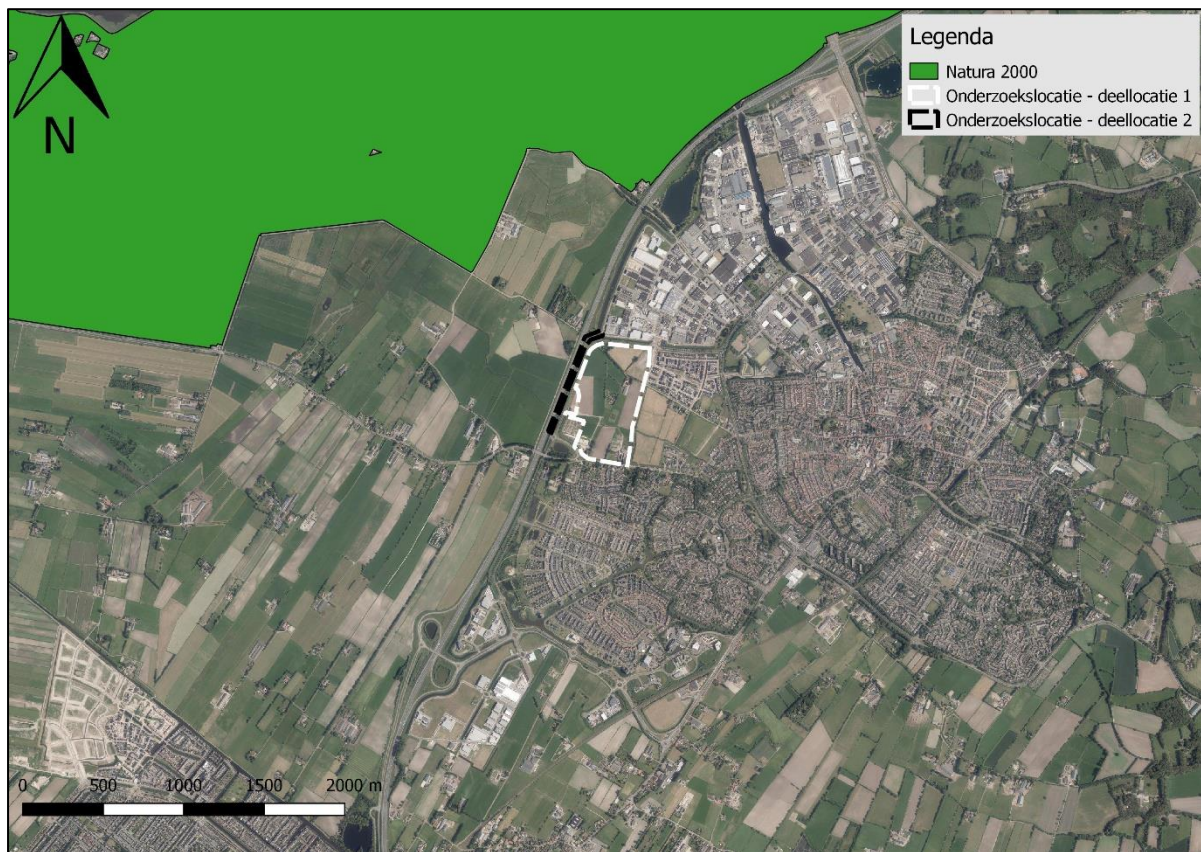
Figuur 23. Ligging onderzoekslocaties ten opzichte van Natura 2000.

De onderzoekslocaties zijn niet gelegen binnen de grenzen van een gebied dat aangewezen is als Natura 2000. De onderzoekslocaties zijn wel gelegen in de nabijheid van een Natura 2000-gebied. Het meest nabijgelegen Natura 2000-gebied, Arkemheen, bevindt zich op circa 1,0 km afstand ten noordwesten van de onderzoekslocaties (zie figuur 23).