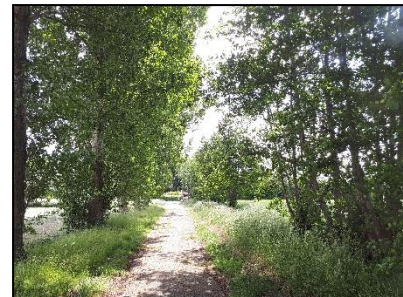
Figuur 19. Weg en populierenrij langs de Doornsteeg op noordelijke helft van onderzoekslocatie 1, gezien vanuit het noordwesten.