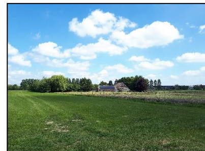
Figuur 10. Centraal gelegen boerderij binnen onderzoekslocatie 1, gezien vanuit het westen.