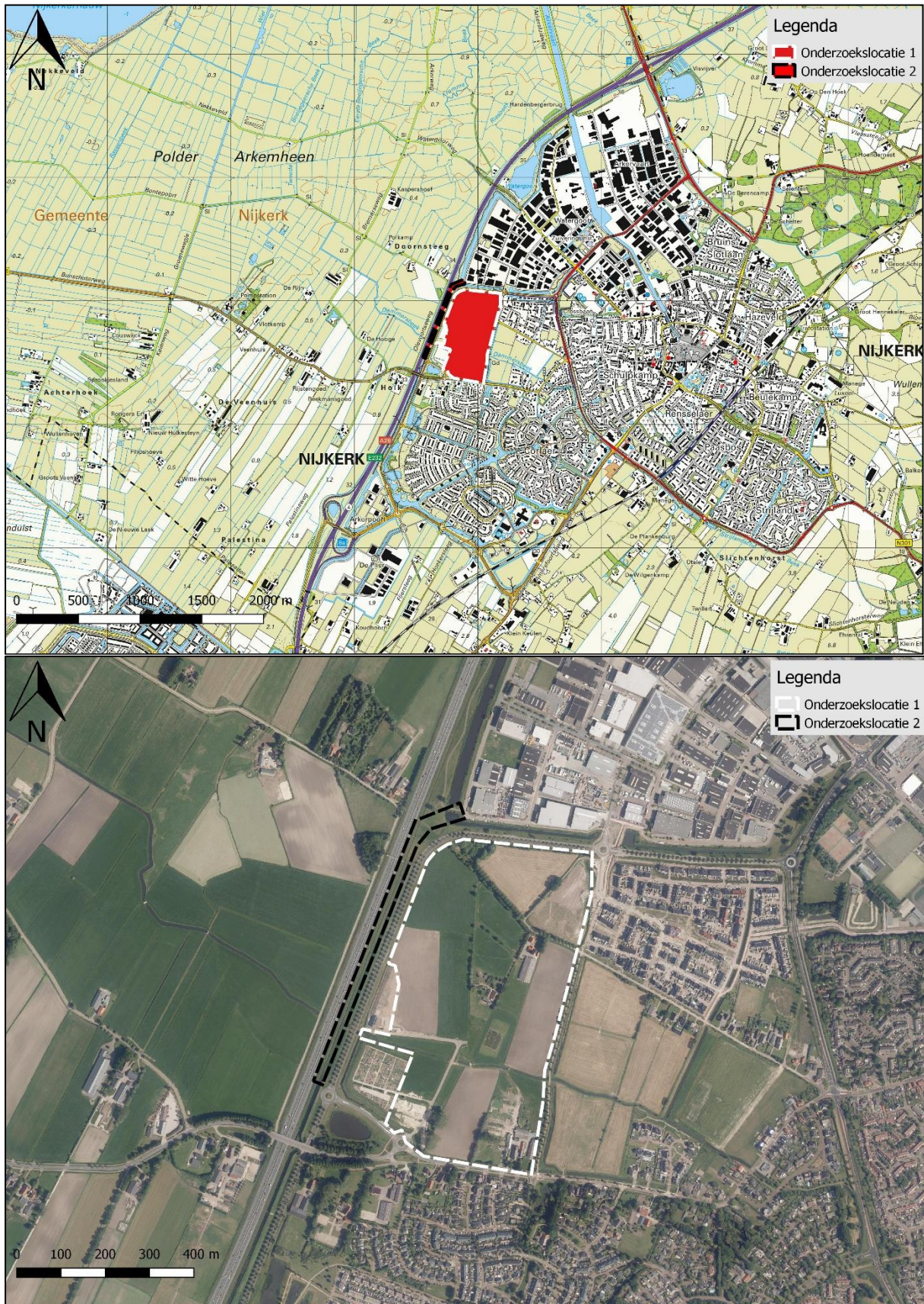
Figuur 1. Topografische kaart (boven) en luchtfoto (onder) van de onderzoekslocaties en omgeving.