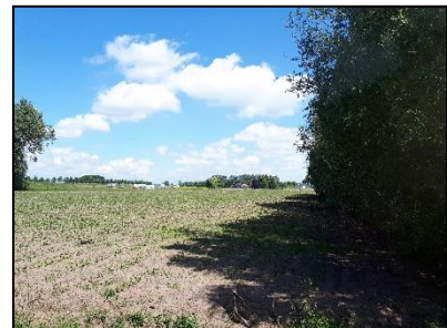
Figuur 7. Zuidelijke rand van onderzoekslocatie 1, gezien vanuit het zuiden.