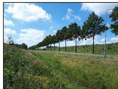
Figuur 12. Bomenrij langs onderzoekslocatie 2, gezien vanuit het noordoosten.