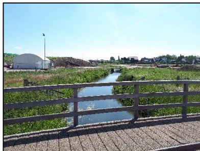
Figuur 6. De Dammersbeek op de zuidelijke helft van onderzoekslocatie 1, gezien vanuit het westen.