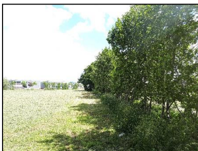
Figuur 20. Haag en bomen langs grasland op noordelijke helft van onderzoekslocatie 1, gezien vanuit het zuiden.