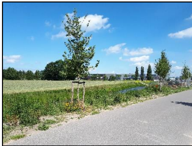
Figuur 2. Noordoostelijke helft van onderzoekslocatie 1, gezien vanuit het oosten.