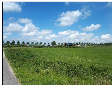
Figuur 9. Gebouw van de scouting langs de westgrens van onderzoekslocatie 1, gezien vanuit het oosten.