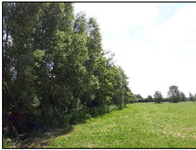
Figuur 14. Bomenrij langs grasland in noordwesthoek van onderzoekslocatie 1, gezien vanuit het noordwesten.