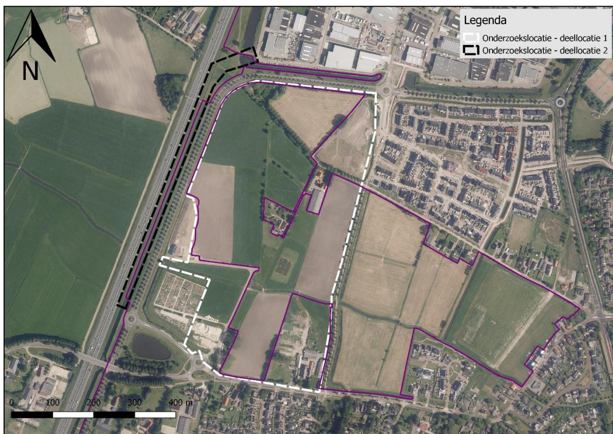
Figuur 25. Begrenzing bebouwde kom (paars) en houtopstanden onderzoekslocaties.

Een deel van de bomen op de onderzoekslocaties valt niet onder de definitie houtopstanden, als bedoeld in paragraaf 4.1 van de Wet natuurbescherming. Deze bomen betreffen wegbeplanting of eenrijige beplanting langs landbouwgronden, bestaande uit populieren of wilgen. Voor deze houtopstand geldt geen meldingsplicht en herplantplicht.