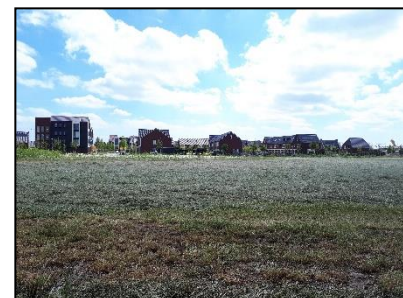
Figuur 22. Braakliggend terrein langs oostzijde van onderzoekslocatie 1, gezien vanuit het westen.

In figuur 1 zijn een topografische kaart en luchtfoto van de onderzoekslocaties en de directe omgeving weergegeven. De figuren 3 t/m 22 geven een impressie van de onderzoekslocaties, middels foto's die zijn genomen tijdens het veldbezoek (d.d. 27 mei 2020).