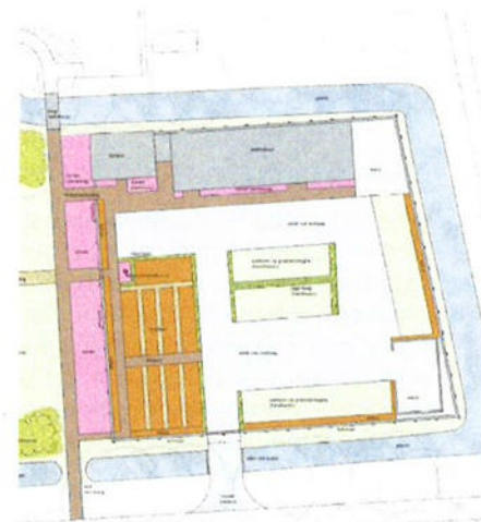
Afbeelding 4. Zuidelijke deel van de tuin met moestuin, parkeerplaatsen en inrit.