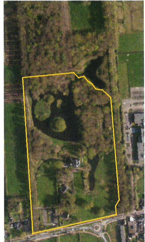
Afbeelding 1. Landgoed Hoevelaken met landgoedkern (geel omrand)

In het rapport 'Tuinhistorische waardestelling Huis Hoevelaken te Hoevelaken' (SB4, mei 2017) is deze waardering voor afzonderlijke deelgebieden en elementen nader gespecificeerd conform de Richtlijnen Tuinhistorisch Onderzoek, waarbij onder meer is ingegaan op de samenhang, herkenbaarheid en functionaliteit.