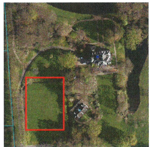
Afbeelding 2. Grasveld waar zwembad, poolhouse en pergola zijn beoogd.