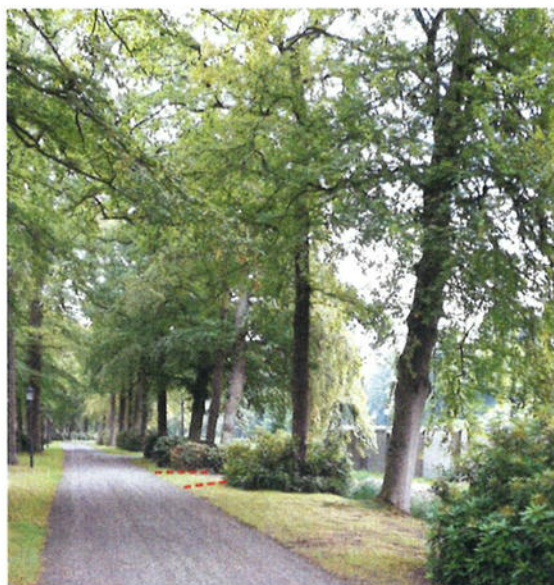
Afbeelding 5. In het rood aangegeven de doorgang van de voorgestelde inrit

Het toevoegen van een doorgang in de westelijke muur is op zich niet ondenkbaar. De entreelaan met zijn brede bermen en laanbomen worden door de nieuwe entree visueel nog een keer onderbroken door een extra zijweg naar de parkeerplaats. Na overleg is gekozen voor een dam, waarbij de verharding een breedte van 4 m heeft, de duiker een uitwendige doorsnede van 1,2 m heeft en waarbij de uiteinden van de duiker de helling van het talud volgen. Om het effect van de onderbreking van de gracht te minimaliseren is gekozen voor duiker met een zo groot mogelijke doorsnede. De gekozen breedte is voldoende om toegang voor vrachtwagens mogelijk te maken. Voertuigen hoeven elkaar immers niet te tegelijk te kunnen passeren. Een mindere breedte zou problemen geven met de draaicirkel vanaf de weg en zou gevolgen kunnen hebben voor de veiligheid.