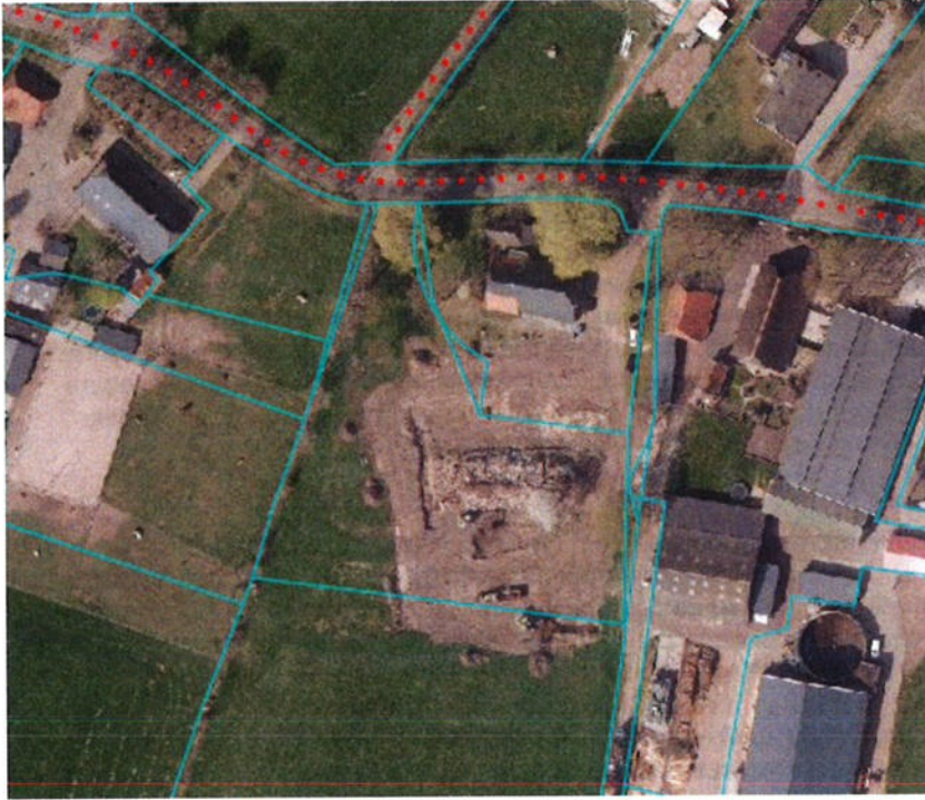
Huidige situatie erf