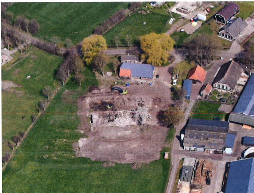
Luchtfoto Noordzijde huidige situatie

De bestaande bedrijfswoning en een reeds aanwezige kleine woning in het voormalige bakhuis zijn nog aanwezig.