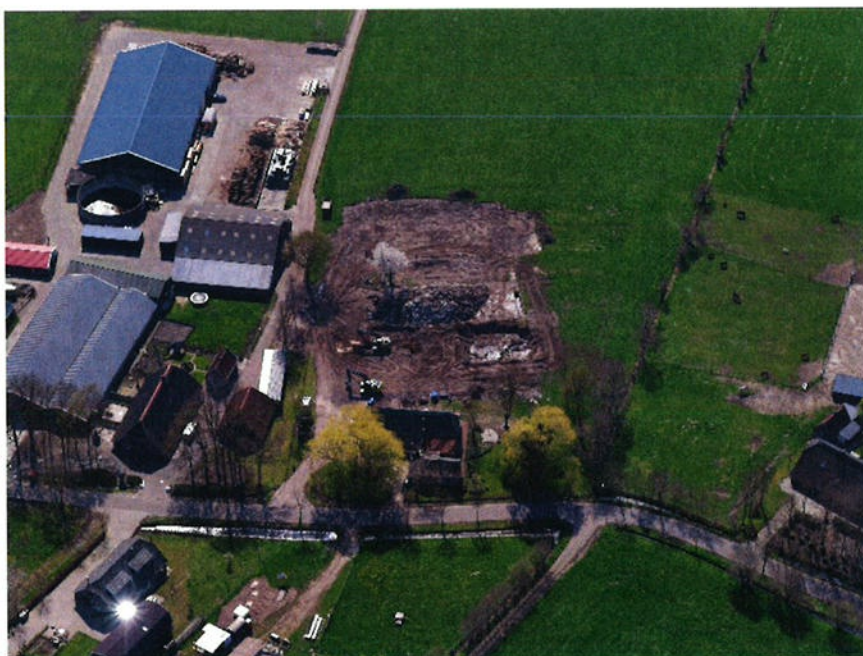
Luchtfoto Zuidzijde Slichtenhorsterweg 65-65a