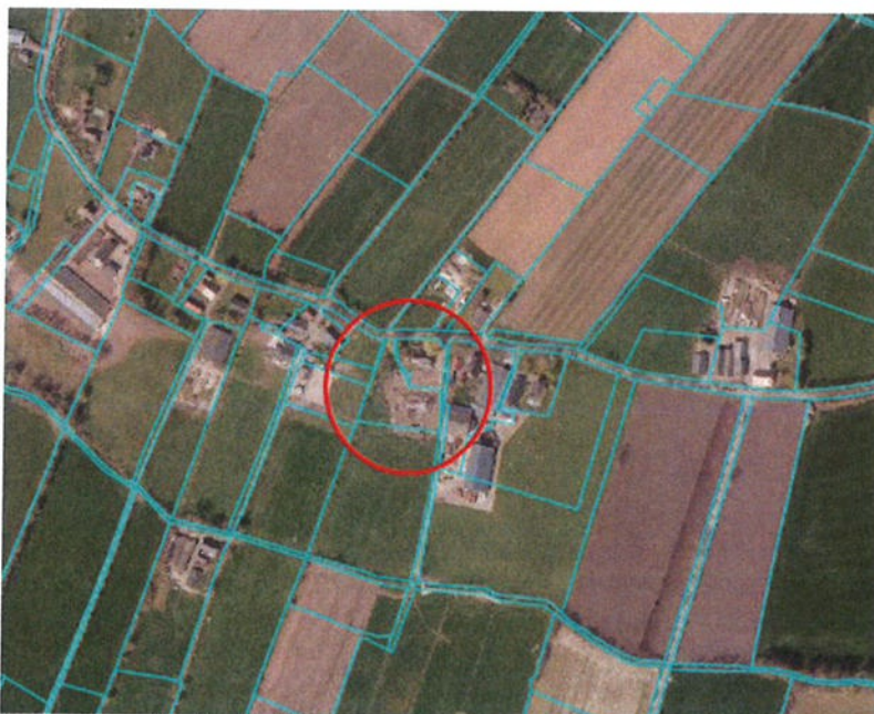
Globale ligging (rood omlijnd)

Het plangebied bestaat uit het perceel met de kadastrale aanduidingen sectie F, nummer 1654, 1655 en bebouwing op perceel F 1656.