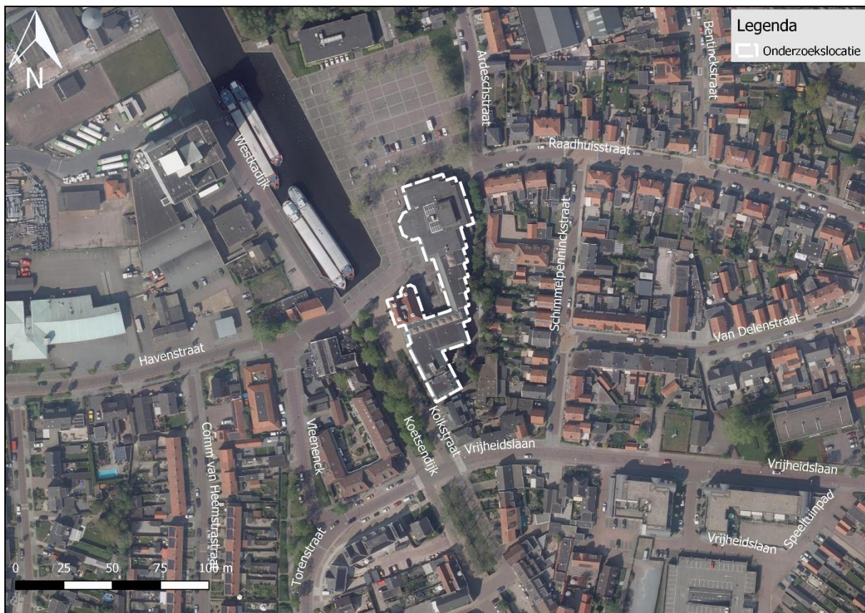
Figuur 2. Luchtfoto ligging onderzoekslocatie.

De onderzoekslocatie betreft het monumentale deel van het gemeente-/stadhuis (westelijk deel) en een later aangebouwd deel (noord, oost en zuid deel). De gebouwen zijn door de gemeente Nijkerk in gebruik als stadhuis. De directe omgeving van de onderzoekslocatie bestaat in alle windrichtingen uit stedelijk gebied. Ten noorden van de onderzoekslocatie bevindt zich de Arkervaart en een grote tuin, behorend bij Nijverheidstraat 6 en onderdeel van fase 2 van het plan. Circa 1,7 km ten westen van de onderzoekslocatie bevindt zich de Rijksweg A28.