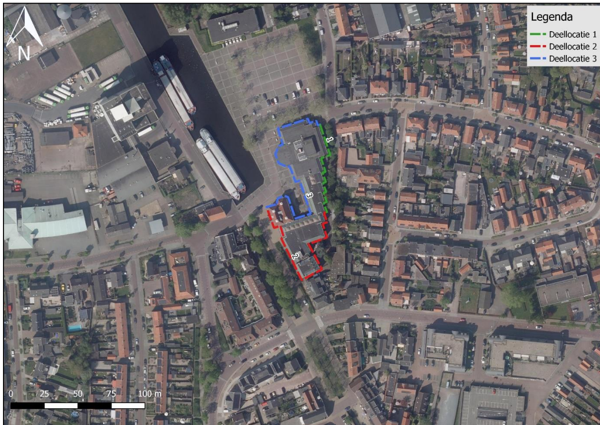
Figuur 3. De onderzoekslocatie onderverdeeld in 3 deellocaties (1 groen; 2 rood; 3 blauw).

Tabel I bevat een overzicht van de uitgevoerde veldbezoeken.