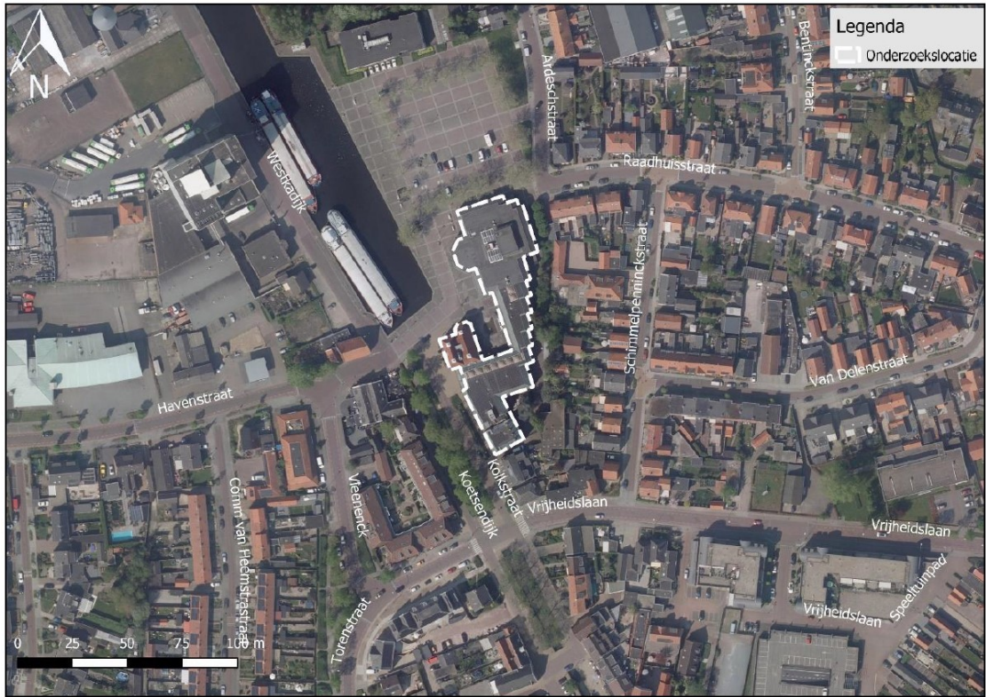
Figuur 2. Begrenzing projectgebied Kolkstraat 27 te Nijkerk.