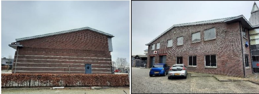
Figuur 3. De tijdelijk verblijfplaatsen in de vorm van vloermuiskasten worden opgehangen aan de oost- en westgevels van de brandweerkazerne aan de Havenstraat 5a te Nijkerk op circa 200 meter van het plangebied.