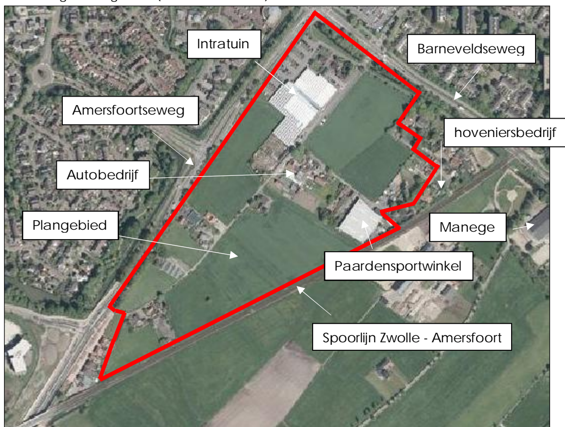
Afbeelding 1: Plangebied

Het plangebied wordt omringd door de Amersfoortseweg (noordzijde), Barneveldseweg (oostzijde) en de spoorlijn Zwolle - Amersfoort (zuidzijde) in Nijkerk. In afbeelding 1 staat met rode lijn het plangebied aangegeven. De Intratuin binnen het plangebied wordt gehandhaafd en is een milieubelastende bestemming. Daarnaast bevinden zich binnen het plangebied een paardensportwinkel en een autobedrijf, welke na de bestemmingsplanwijziging worden beëindigd.