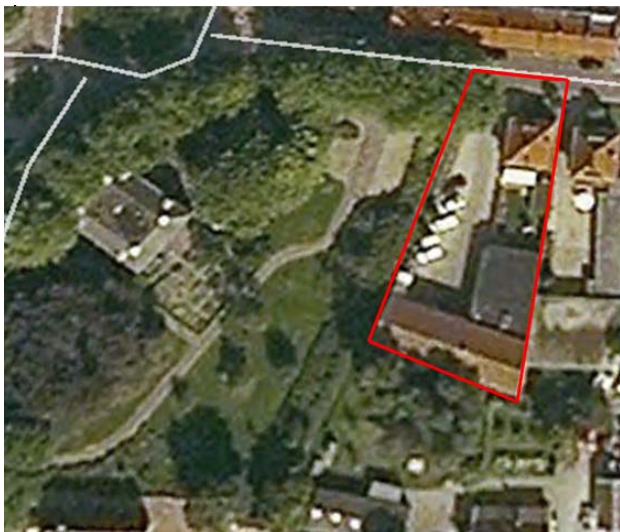
Figuur 1 Luchtfoto locatie Brink 40 in Nijkerk