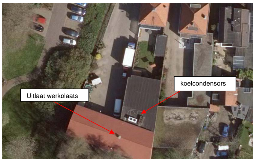
Figuur 4 Luchtfoto van de bedrijfsgebouwen van Van der Pol Kipspecialiteiten

De uitlaat van de werkplaats bevindt zich op iets meer dan 50 meter afstand van de dichtstbijzijnde gevel van Huize Brink. Op grond daarvan kan geconcludeerd worden dat geurhinder niet van invloed is op het woon- en leefklimaat van Huize Brink, want de maatgevende afstand tussen de mogelijke geurbron van het bedrijf en de toekomstige verblijfsruimten is groter dan de worstcase richtafstand van 50 meter.