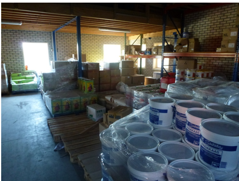
Figuur 2 Opslag

In figuur 1 is een overzicht gegeven van de situatie van de beoogde uitbreiding. Op dit terrein wordt een opslagloods gerealiseerd voor de opslag van verpakkingsmaterialen, rijst, sauzen, oliën etc. Alles in goed gesloten transportverpakkingen (zie figuur 2).