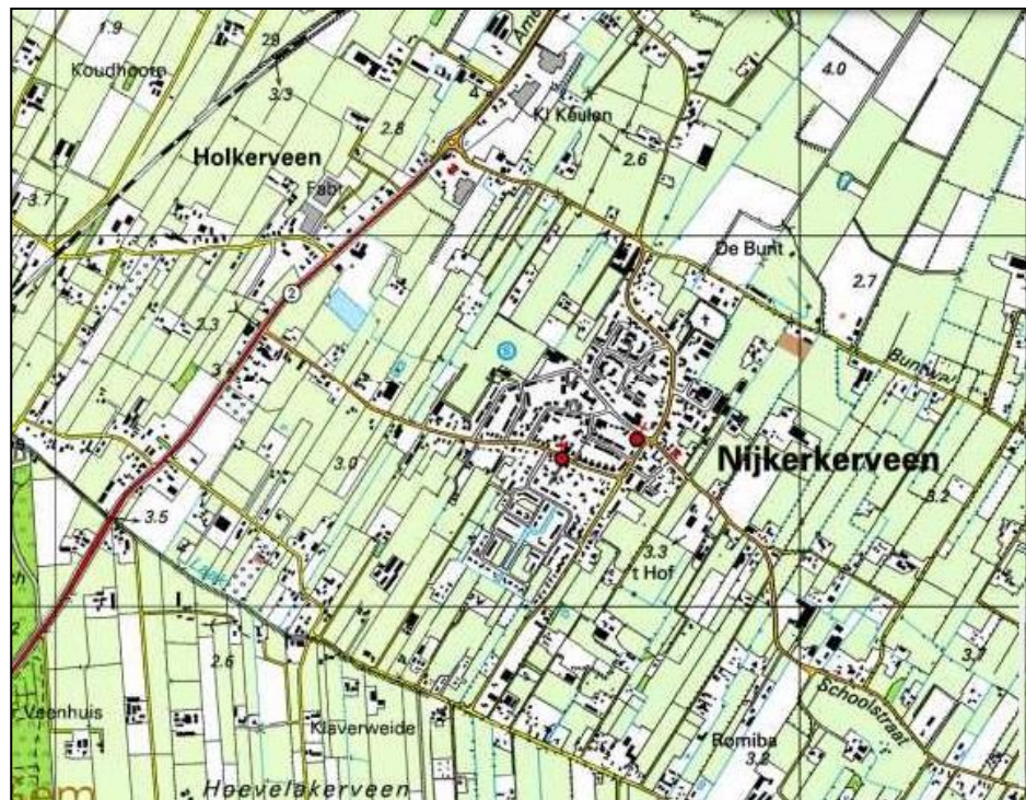
Figuur 1.1: Topografische kaart Nijkerkerveen en omgeving (watwaswaar.nl)

Nijkerkerveen is een compact dorp in een oude veenontginning. Rondom het dorp is een kleinschalig slagenlandschap aanwezig. Dit wordt gekenmerkt door lange smalle percelen die veelal worden gescheiden door elzensingels (figuur 1.1).