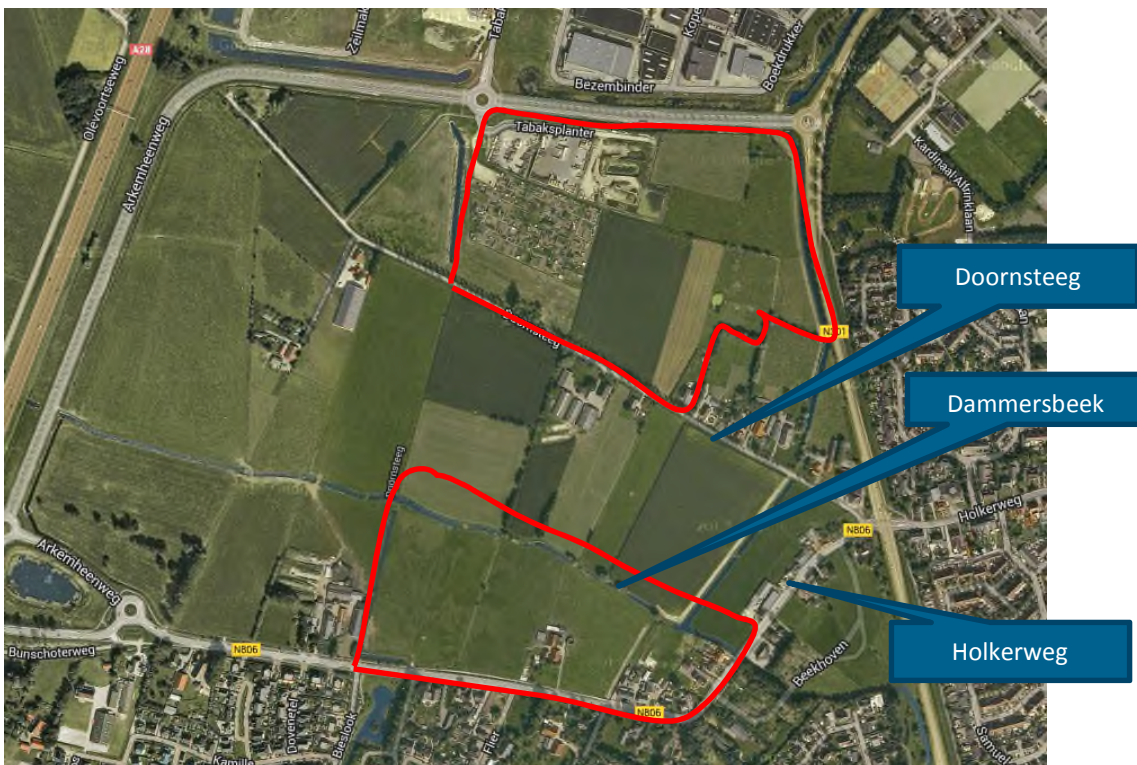
Figuur 2 Locatie cultuurhistorisch waardevolle structuren

Ten aanzien van landschap en cultuurhistorie is geadviseerd om rekening te houden met de cultuurhistorische structurerende elementen binnen het plangebied (de Dammersbeek, de Doornsteeg en de Holkerweg) (zie figuur 2). Daarnaast is geadviseerd om het huidige landelijke karakter te behouden in profiel en materialisering met inbegrip van de taluds, beplanting en sloten. Om het continue karakter van de Doornsteeg te behouden is geadviseerd deze zo min mogelijk te doorkruisen of onderbreken. Daarmee wordt belangrijke negatieve effecten op landschap en cultuurhistorie voorkomen.