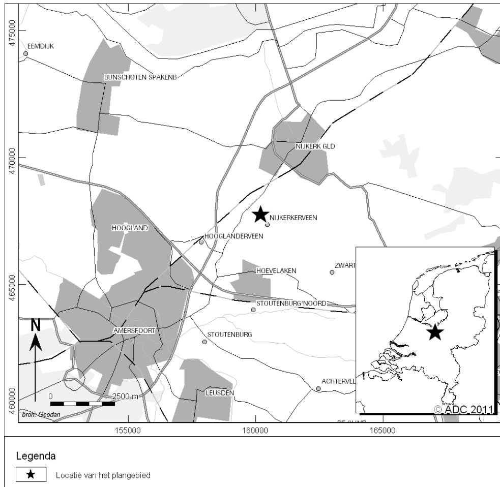
Afb. 1 Locatie van het plangebied