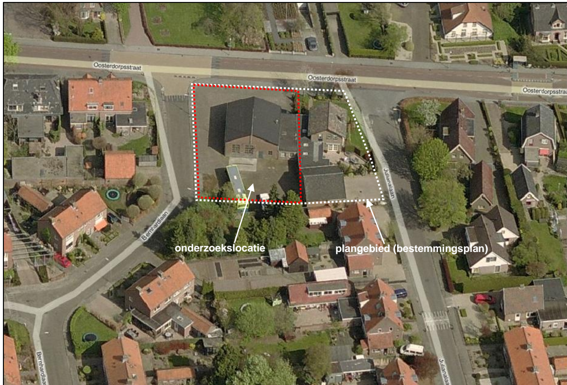
Figuur 2. Luchtfoto plangebied en directe omgeving.