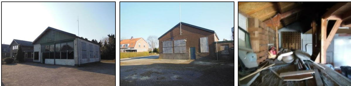
Figuur 3. Impressie van de onderzoekslocatie