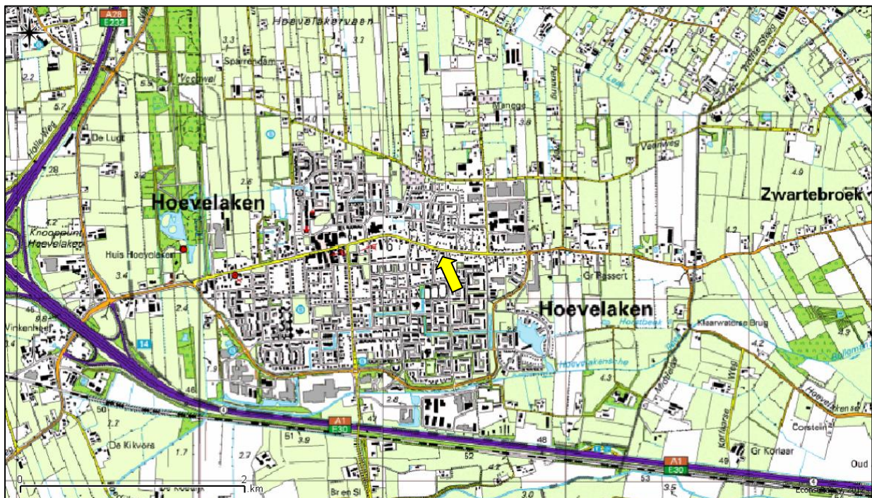
Figuur 1. Topografische ligging onderzoekslocatie.

De onderzoekslocatie is kadastraal bekend gemeente Nijkerk, sectie C, nummer 3025. Volgens de topografische kaart van Nederland, kaartblad 32 E (schaal 1:25.000), zijn de coördinaten van het midden van de onderzoekslocatie X = 160.320 , Y = 465.245 .