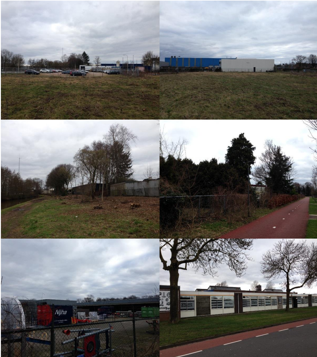
Afbeelding 2. Foto's – impressie plangebied.