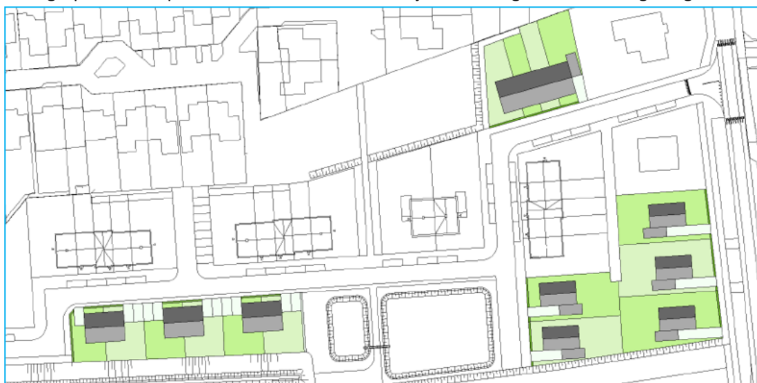
Afbeelding 2: Gewenste toekomstige situatie (concept).

De ingrepen vinden plaats in het kader van ruimtelijke inrichting of ontwikkeling van gebieden.