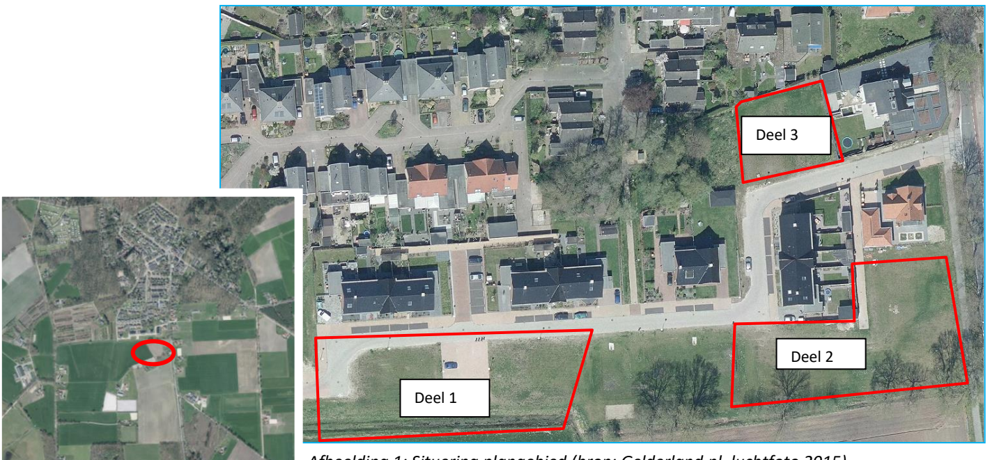
Afbeelding 1: Situering plangebied.

Het plangebied ligt ten zuiden van de bebouwde kern van Barchem en betreft enkele onbebouwde, braakliggende terreinen zonder bomen en oppervlaktewater. De percelen bestaan uit grasvelden en een enkele verharding.