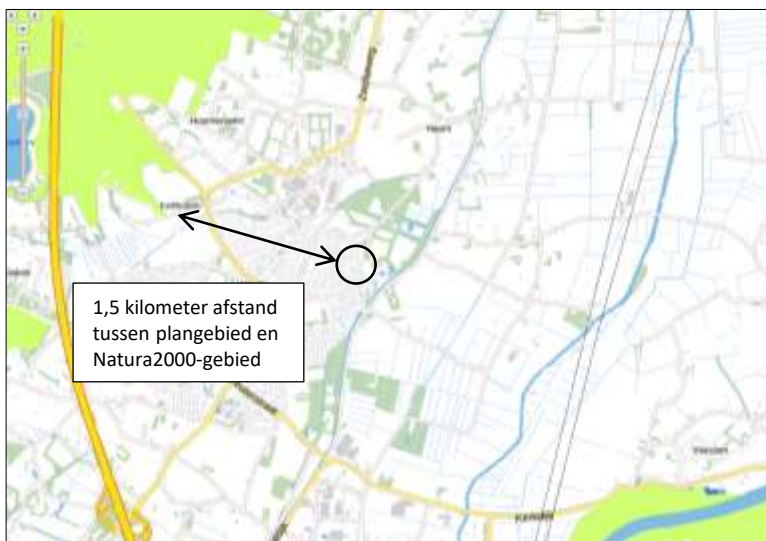
Ligging van Natura2000-gebied in de omgeving van het plangebied.

Het plangebied behoort niet tot Natura2000. Gronden die tot Natura2000 behoren liggen op minimaal 1,5 kilometer afstand ten zuidwesten van het plangebied (bron: Provincie Gelderland). Op onderstaande afbeelding wordt de ligging van Natura2000-gebied in de omgeving van het plangebied weergegeven.