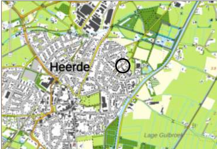
Globale ligging van het plangebied.

Het plangebied is gesitueerd aan de Rooboerskamp 19-21 te Heerde. Het plangebied ligt in de bebouwde kom van Heerde en wordt aan alle zijden omgeven door stedelijk gebied. Op onderstaande afbeelding wordt de globale ligging van het plangebied weergegeven.