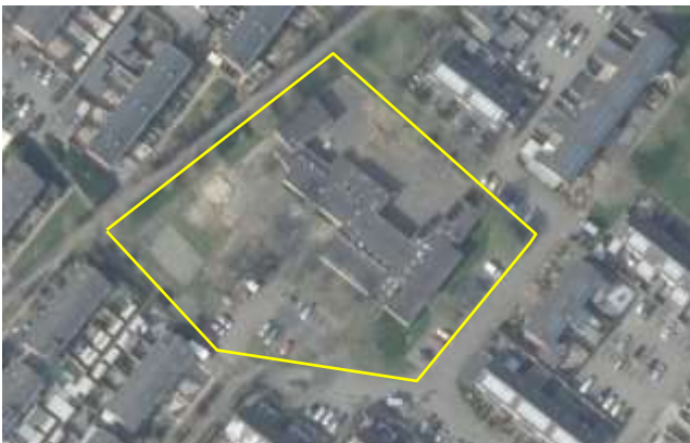
Detailopname van het plangebied.

In het plangebied staat een voormalig lagere schoolgebouw met daaromheen erfverharding, gazon en enkele heesters en solitaire bomen. Het voormalige schoolgebouw is gebouwd van bakstenen en heeft een met bitumen dakleer gedekt plat dak. Aan de westzijde van het plangebied staat een bakstenen fietsenhok dat aan één zijde open is. Het schoolgebouw beschikt over een holle spouw en een kunststof boeiboord. Het gebouw stond tijdens het veldbezoek leeg, maar verkeerd in een goede staat van onderhoud. Op onderstaande afbeelding wordt het plangebied in detail weergegeven, evenals de begrenzing. Voor een verbeelding van het plangebied wordt naar de fotobijlage verwezen.