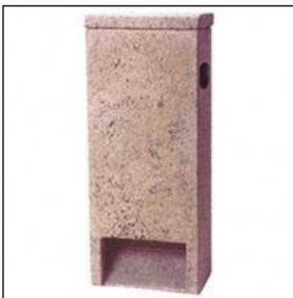
Figuur 1: Voorbeeld in te metselen vleermuiskast

Er zijn speciaal voor vleermuizen ontwikkelde kasten op de markt die in de muur kunnen worden ingemetseld. De inbouwkasten kunnen via een open stootvoeg toegankelijk worden gemaakt. Laatvliegers maken geen gebruik van dergelijke voorzieningen.