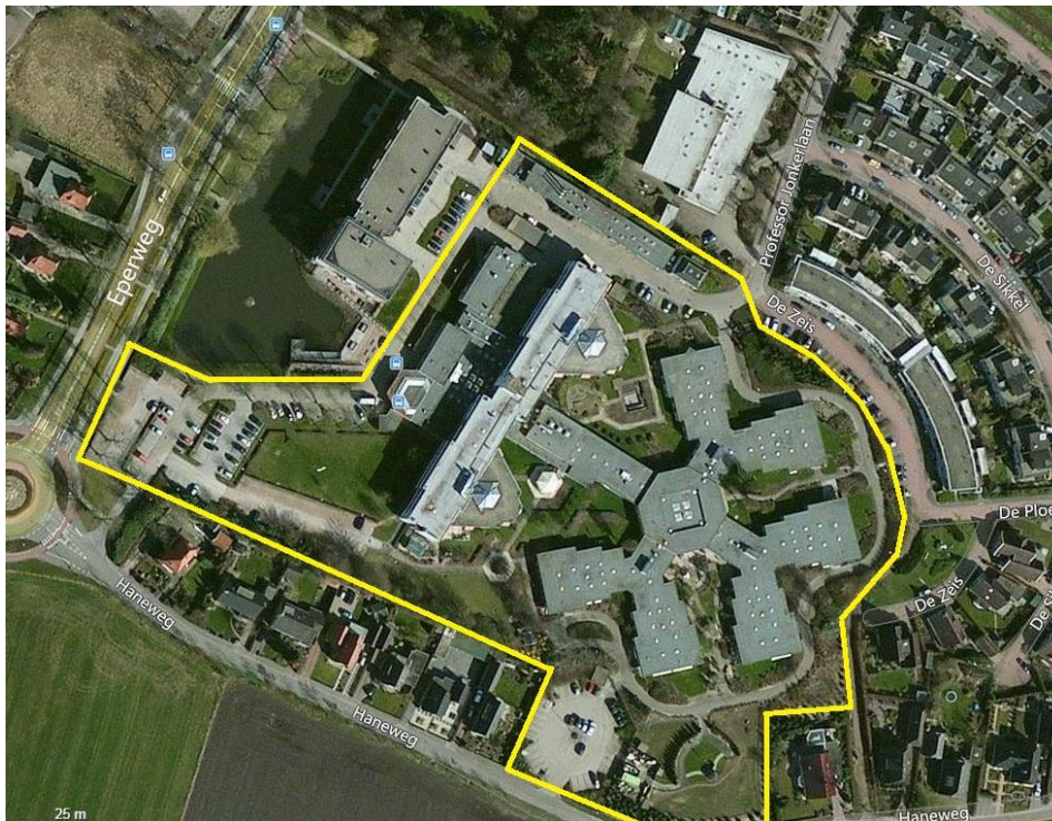
Figuur 1.1: Ligging van het plangebied (binnen gele omlijning).

Het plangebied bestaat uit de oudere gebouwen op het terrein van de Wendhorst aan de Eperweg 33, omliggende beplanting en bestrating. Er is ook een dierenweide en een kas aanwezig. Men is voornemens om op het gazon aan de westzijde nieuwe zorgvoorzieningen te bouwen. Na gereedkoming en verhuizing van de bewoners kan het oude complex geheel afgebroken worden. De capaciteit van de Wendhorst wordt teruggebracht van 150 naar circa 90 bewoners, waardoor de nieuwbouw minder ruimte zal innemen. Er zijn nog geen concrete plannen met de vrijkomende grond. Mogelijk vindt hier in de toekomst woningbouw plaats door derden. Deze ontwikkelingen zijn daarom geen onderdeel van deze toets.