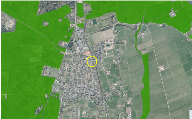
Ligging van het plangebied nabij het Gelders Natuurnetwerk. Het plangebied wordt met de gele cirkel aangeduid.

Het plangebied ligt niet in of direct naast gronden die tot het Gelders Natuurnetwerk (verder GNN genoemd) behoren. Gronden die tot het GNN behoren liggen minimaal 610 meter verwijderd van het plangebied. Op onderstaande kaart wordt de ligging van het Gelders Natuurnetwerk (donkergroen) weergegeven. De ligging van het plangebied wordt met de cirkel aangeduid.