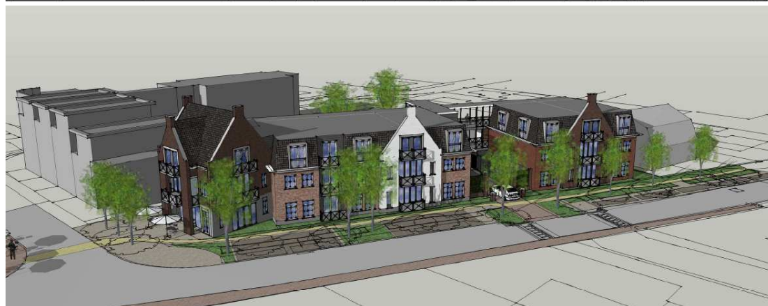
Plattegrond en gevelaanzicht van de nieuwe bebouwing.