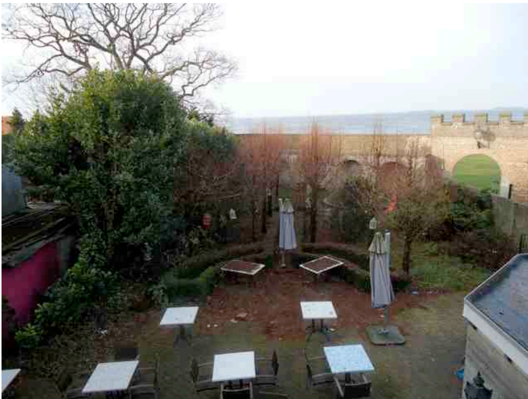
Zicht op de tuin vanaf de eerste verdieping van het huis