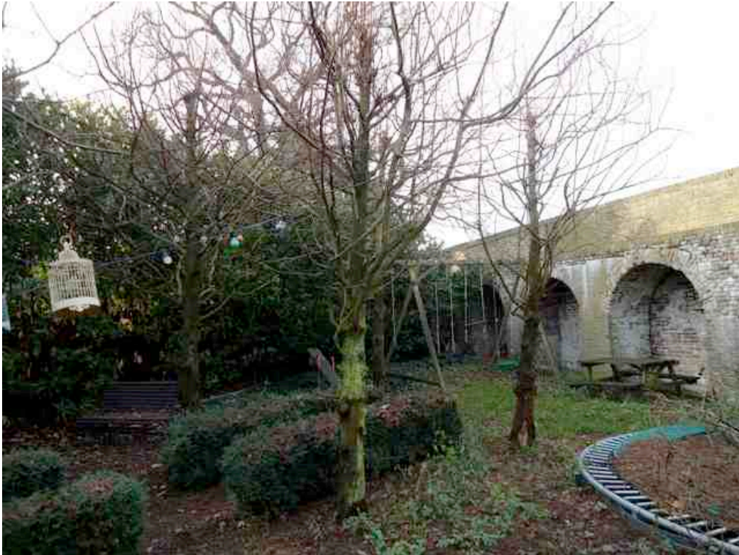
Tuinbeplanting en op de achtergrond de stadsmuur