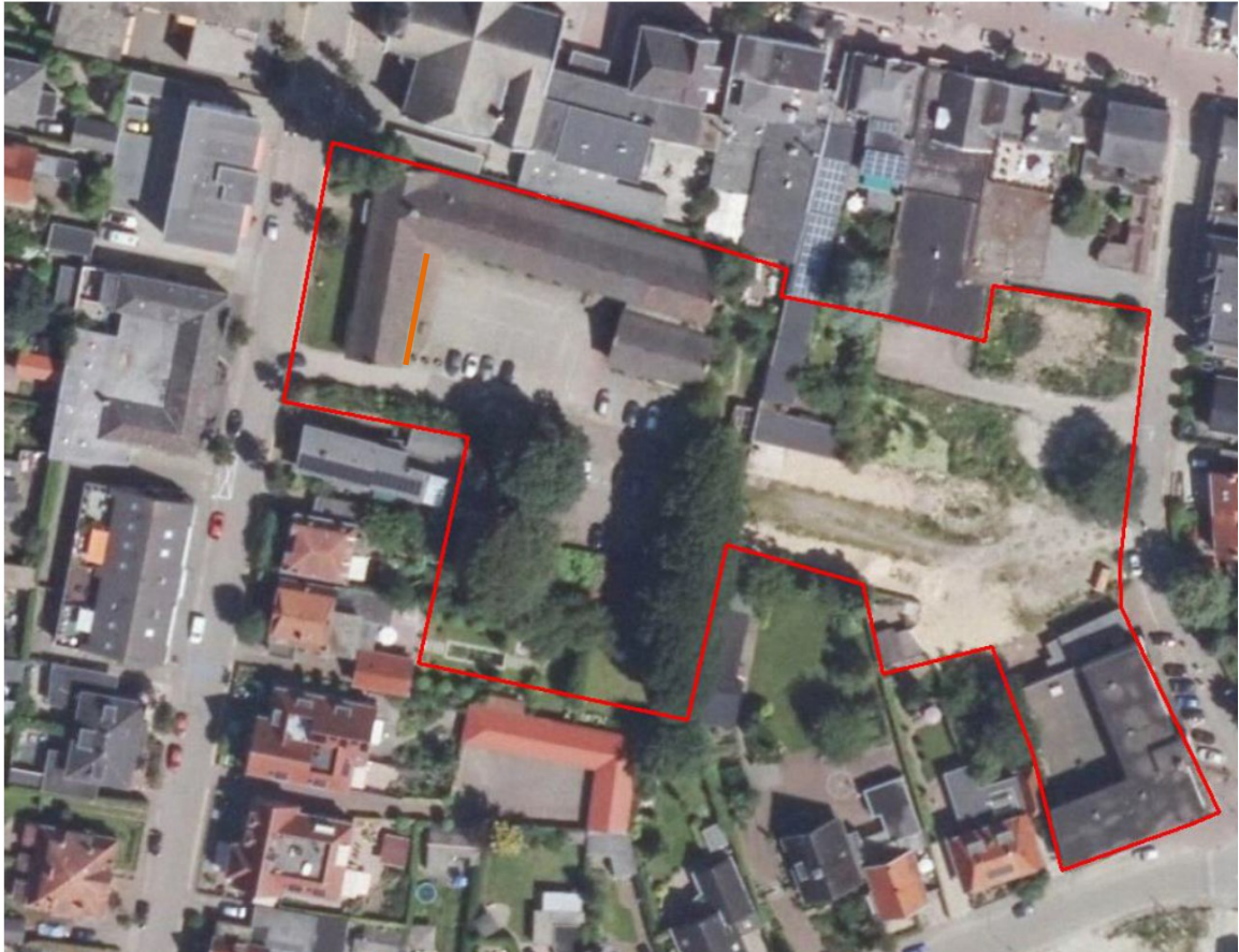
Figuur 1: Locatie waar de zes nesten van de Huismus zijn vastgesteld waarop dit besluit betrekking heeft (oranje lijn), binnen het plangebied Kerklaan – Postlaantje (rode lijn) te Ermelo