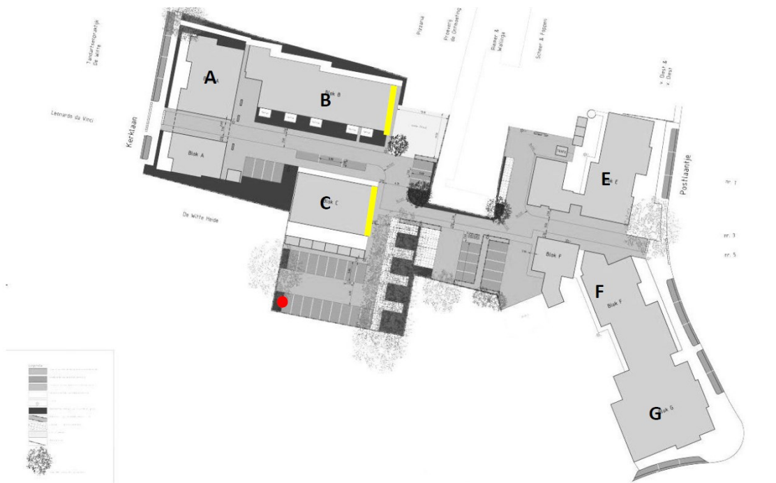
Figuur 4: Locatie huismussentil (rode stip) en permanente nestlocaties in de bouwblokken B en C (gele markering).