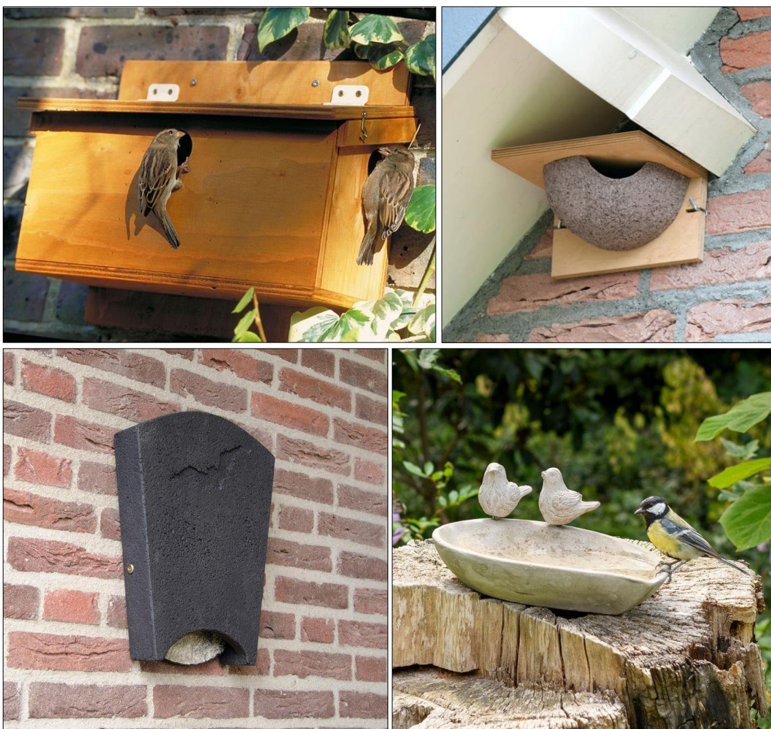
Afbeelding 1 t/m 4. Met de klok mee: huismuskast, huiswaluwkom, waterschaal en vleermuiskast.

Doordat de huidige woningen vaak voorzien zijn van bitumen dakbedekking, waar vogels geen nest onder kunnen maken en om meer nestgelegenheid te creëren, worden in het hele park 15 nestkastjes opgehangen, zowel voor huismus, boeren of -huiswaluw als mezen en boomkruiper. Ook wordt een vleermuiskast en een drietal insectenhôtels opgehangen. In tabel 1 zijn de type kasten en op-hangvereisten vermeld.