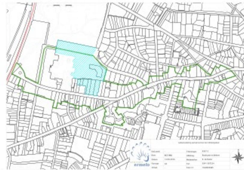
Afbeelding 4-2 Afbakening kernwinkelgebied Ermelo

Het blauwe gearceerde gebied maakt geen onderdeel uit van deze nota. Dit betreft projectgebied Markt 2.0 waarvoor aparte afspraken zijn gemaakt met de betreffende ontwikkelaars.