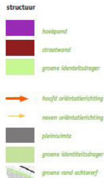
afbeelding uit beeldkwaliteitsplan Stationsstraat ter plaatse van plangebied