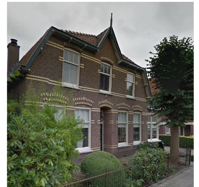
karacteristieke bebouwing in Kerklaan en dr Holtropstraat