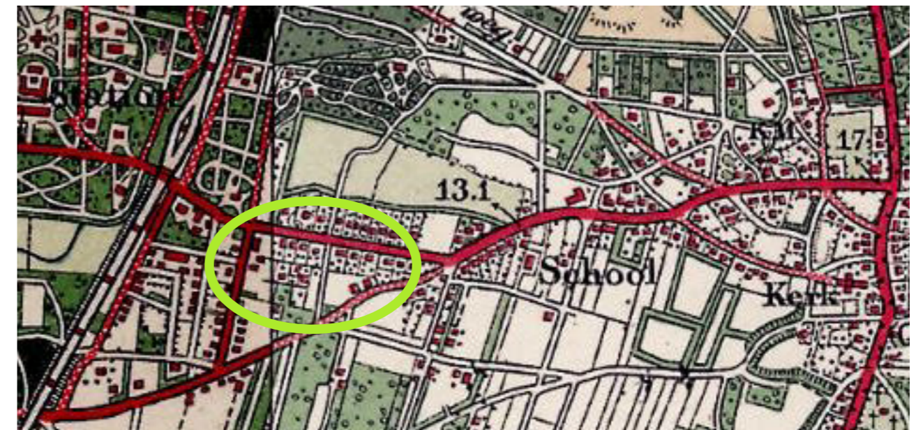
het plangebied anno ca. 1925, gelegen tussen Stationsstraat, Kerklaan en Postlaantje